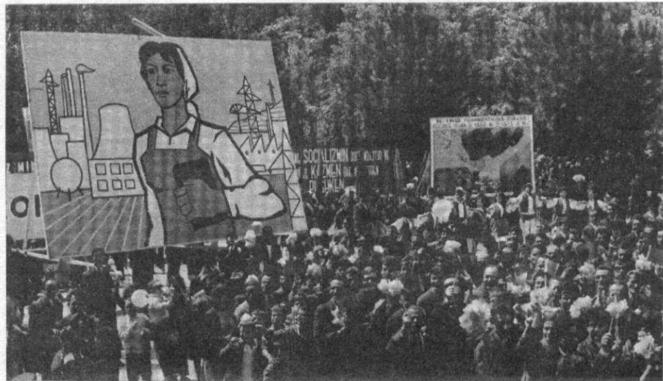
Lors de la préparation du 6 e Congrès, les masses manifestent leur indéfectible attachement au Parti.

Il a été désormais historiquement démontré que sans son Parti, la classe ouvrière, quelles que soient les conditions dans lesquelles elle vit et agit, ne peut acquérir d'elle-même la