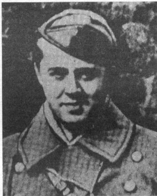
C'est sous la direction du Parti du Travail d'Albanie que s'est menée la lutte de Résistance contre le fascisme (1939-1945).

La base des alliances possibles s'élargit encore davantage lorsqu'il s'agit de révolutions démocratiques anti-impérialistes, auxquelles peut participer, outre la paysannerie et la petite-bourgeoisie des villes, la bourgeoisie nationale également. Mais quel que soit le poids de ces couches