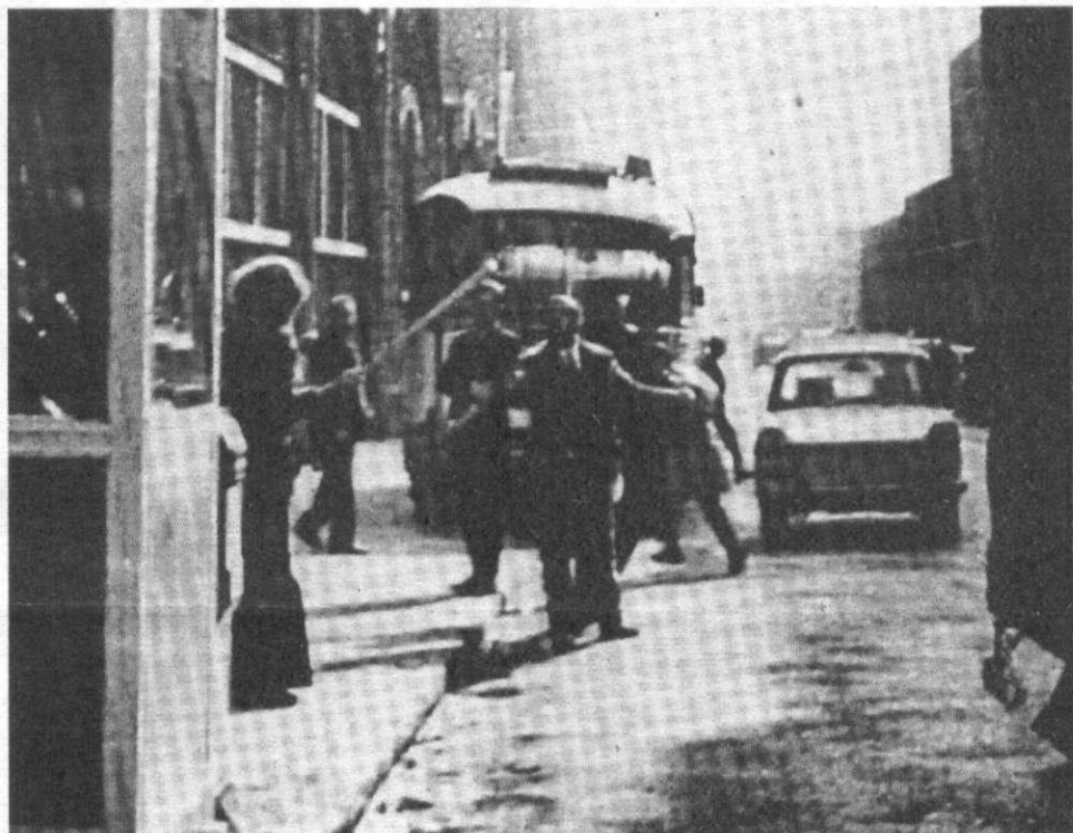
Sans cette photo probante, l'assassin aurait été acquitté !

Par tous les moyens il faudra riposter au scandale.