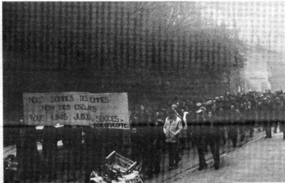
Manifestation de solidarité avec les grévistes de CEGEDUR

« Pourquoi les travailleurs de CEGEDUR sont-ils en grève ? »