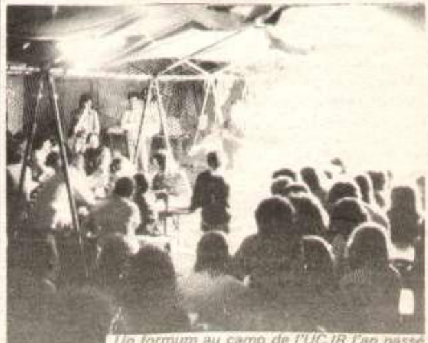
Un forum au camp de l'UCJR l'an passé