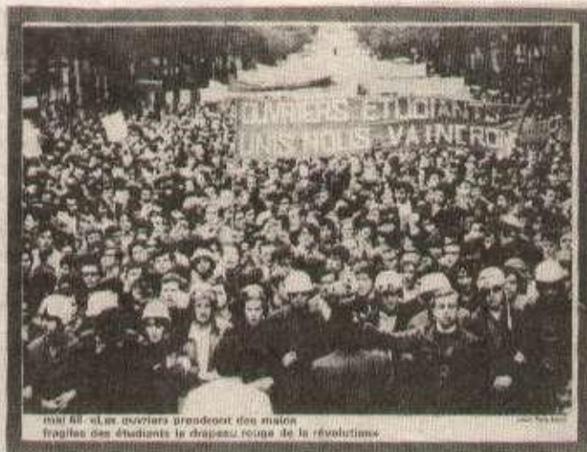
1976 - Les ouvriers prennent des mains fragiles des étudiants le drapeau rouge de la révolution.

Pour soutenir le Quotidien du Peuple, des calendriers, affiches et cartes postales en couleur sont à votre disposition