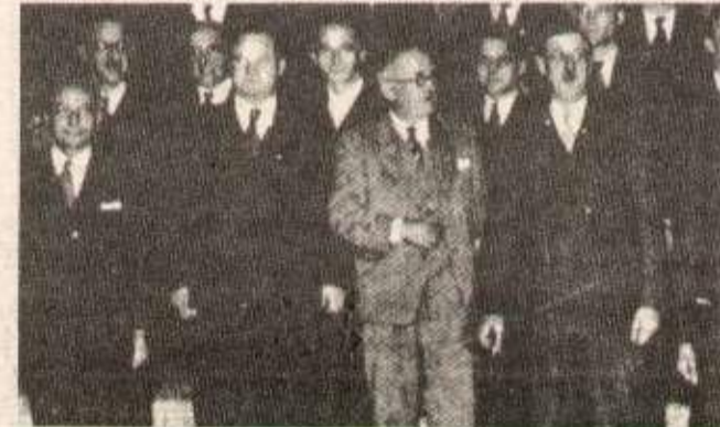
Thorez et De Gaulle dans le même gouvernement en 45

cherchent à décourager la classe ouvrière, à décourager le peuple, c'est la nouvelle forme de l'attentisme, du munichisme, du non-interventionnisme. Hier, on spéculait sur la lâcheté, aujourd'hui on voudrait spéculer sur la paresse. Aujourd'hui, on pratique l'encouragement au moindre effort. » ( Discours de clôture de Thorez au Xème congrès du PCF ).