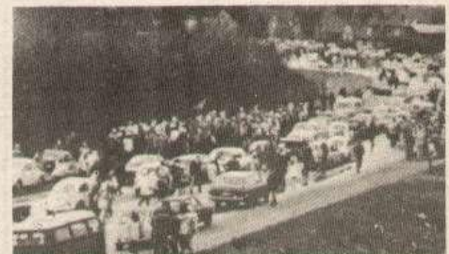
Des milliers de manifestants contre la construction de la centrale de Brokdorff.