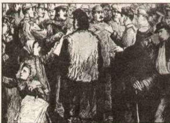
La rue appartient au peuple

Mais malgré la menace de l'étau versaillais, malgré les bombardements, Paris continue à se libérer de toutes les façons.