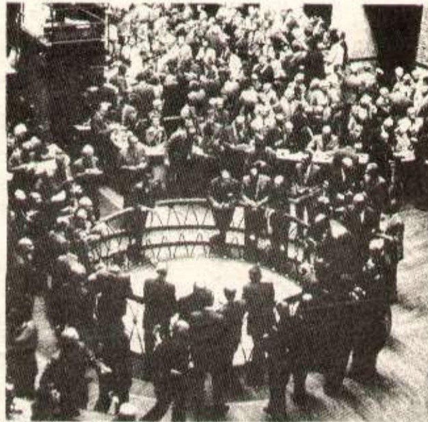
La réforme de l'entreprise : les actionnaires seront mieux protégés... !

Au total, le gouvernement s'oriente vers une meilleure organisation de la gestion des entreprises, dans le but d'éliminer les «canards boiteux» et de favoriser la restructuration du potentiel économique de l'impérialis-