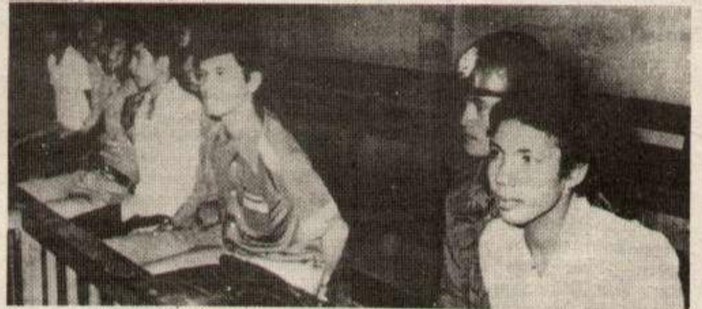
Un procès d'étudiants thaïlandais