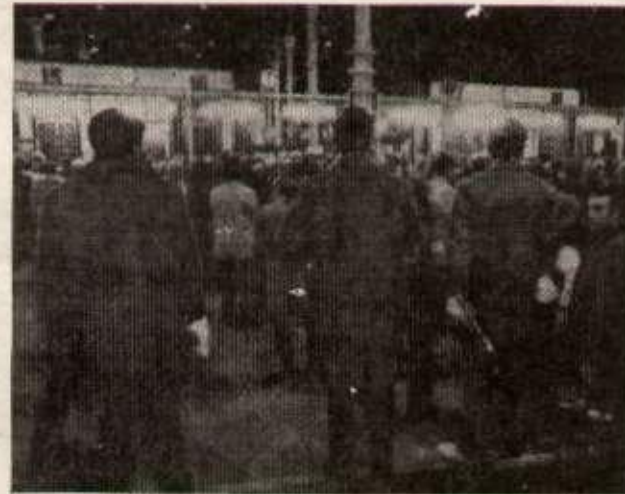
Les grèves de ces derniers mois ont un même objectif : dénoncer le contrat social.

Le 20 avril, à l'appel de 1 700 délégués syndicaux, des milliers de travailleurs britanniques manifesteront pour s'opposer à une troisième année de limitation des salaires. Cet appel lancé juste avant l'ouverture des négociations gouvernement-syndicats sur la politique des revenus témoigne de la volonté affirmée d'un nombre croissant de travailleurs de s'opposer à la politique de contrat social.