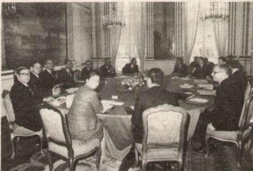
Le nouveau gouvernement Barre : au cours du «séminaire» qu'il tient aujourd'hui, il ne trouvera pas le moyen de sortir de l'impasse.

Les jours prochains verront nécessairement les voiles se déchirer : le parlement européen. Les signataires du programme commun ont fixé un calendrier pour le discuter. Quel que soit l'intérêt qu'ils peuvent avoir de part et d'autre à paraître unis, les partis qui composent les deux grandes coalitions vont devoir se situer les uns par rapport aux autres sur une série de questions.