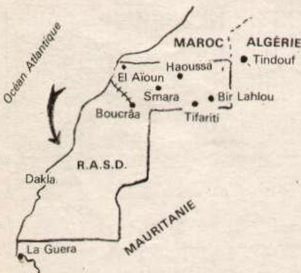
Au Nord de Dakla, les patriotes sahraouis interceptent un navire espagnol livrant des armes aux agresseurs marocains.

Dans son communiqué, le Front Polisario rappelle que le gouvernement espagnol s'était «engagé à garantir l'intégrité territoriale de notre patrie et son indépendance... mais, conclut le communiqué, le peuple sahraoui ne permettra à quiconque de disposer ni de son territoire, ni de ses richesses et ce conformément aux principes internationaux de respect de la souveraineté, de l'intégrité territoriale, de l'égalité de toutes les nations et de la coopération fructueuse pour tous, sans aucun recours ni à la force, ni à la violation, ni à la politique du fait accompli telle qu'elle est suivie par les gouvernements expansionnistes espagnol, marocain et mauritaniens».