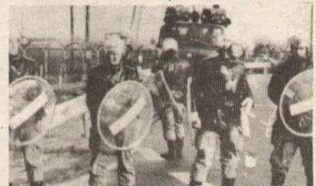
Déploiement massif de forces de police allemande. En novembre dernier, il y avait eu plus de 200 blessés parmi les manifestants.

C'est une victoire importante, mais la lutte continue : la devise des occupants de Wyhl n'est-elle pas : «Kein Kernkraftwerk in Wyhl und auch sonst nirgends» traduction : «Pas de centrale nucléaire à Wyhl et nulle part ailleurs !»