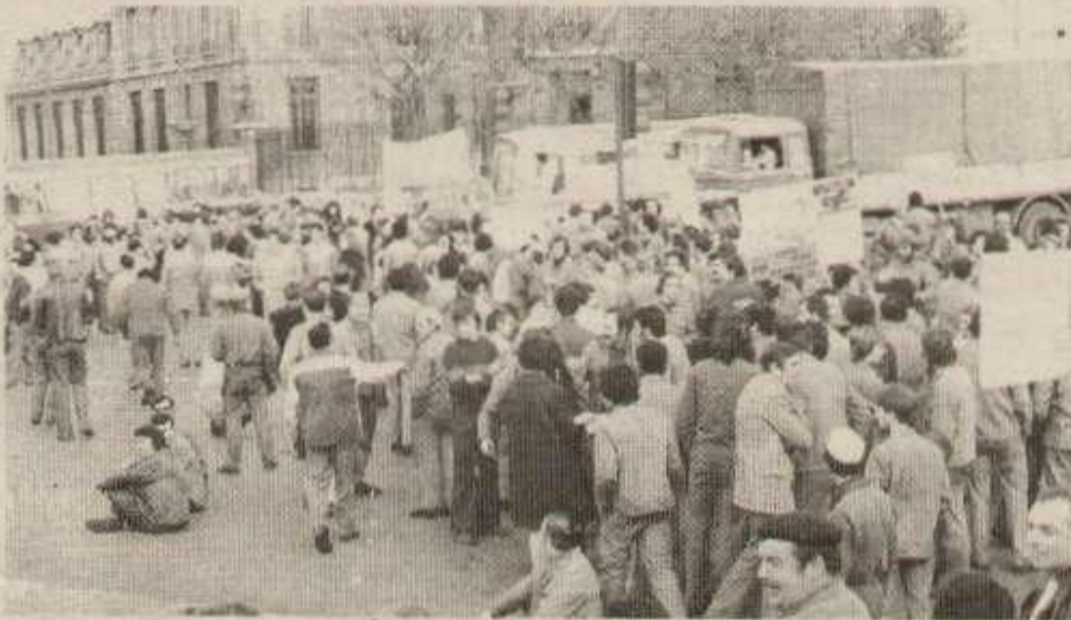
Les travailleurs d'Alsthom, dans la rue, déjà il y a quelques jours.

Pendant que le chauffeur subissait la juste colère des ouvriers massés autour du véhicule, un responsable CGT faisait son discours autour d'un dernier carré de militants.