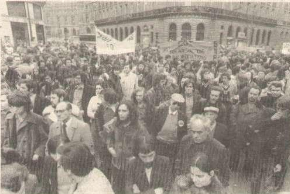
La dernière manifestation : «une volonté de lutte rarement vue depuis 74»

Pour nombre de militants CFDT, les journées d'action en général sans lendemain, n'ont aucun intérêt. Fin avril, ils n'y participeront pas. «Si on avait suivi les mots d'ordre de nos directions, ajoutent-ils, on n'en serait pas là ! Si la direction a subi un premier recul, bien que limité, c'est bien dû aux formes d'action que nous avons mises en œuvre. Contre la répression, nous avons mis en place des piquets de grève, des comités d'accueil qui ont permis la récupération deux fois et en outre de dissuader les nervis du CDS (qui se sont déjà illustrés au Parisien Libéré) ainsi que les milices fascistes d'intervenir. Pour «défendre le droit de grève», nombre de gars le disaient, si la persuasion n'avait pas suffi, on aurait défendu le centre». Cette attitude offensive prise durant ces dernières semaines, toujours en dehors, et bien souvent contre les directions syndicales du centre, n'est pas le moindre acquis de cette grève.