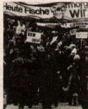
Manifestation contre le projet de centrale nucléaire à Wyhl.

● août 1974 : Marche internationale de 2 000 Alsaciens et Badois sur le futur site nucléaire, en pleine forêt rhénane de Wyhl, contre la centrale (KKW) et le stéréotype de plomb (CWM). Création du comité international des 21 organisations alsaciennes et badoises. Publication d'un manifeste commun.