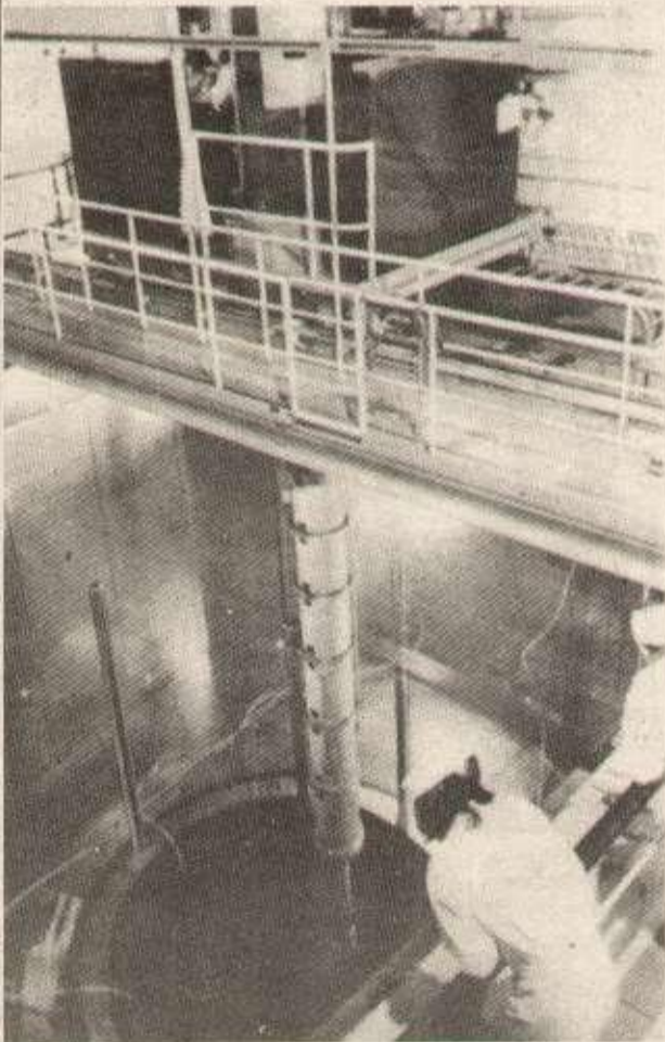
La mise en route du processus de divergence à la centrale de Fessenheim.

Fessenheim : le 25 mai 1975, une dernière grande manifestation réunissait à Fessenheim plus de 10 000 participants. Il y en avait eu deux autres auparavant depuis 1971. Mais la construction de la centrale était déjà presque achevée et le site n'était plus «occupable». La lutte a continué par l'action «lettre au maire» puis la grève de la faim de Roggenhouse et la marche populaire de Colmar et maintenant par l'occupation à Heiteren d'un pylone de 760 000 volts de la ligne Fessenheim-Mery-sur-Seine.