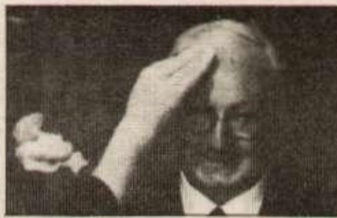
Giuseppe Saragat, secrétaire du parti social-démocrate

Sur le plan économique, la nécessité de l'austérité et de restructurations est affirmée : par ailleurs, les mesures de sélection combattues par le mouvement étudiant ainsi que les lois répressives (droit de garde à vue pour la police, droit de tirer sur les manifestations) sont entérinées. Berlinguer justifie alors cette nouvelle étape vers un compromis historique qu'on ne voit pas venir :