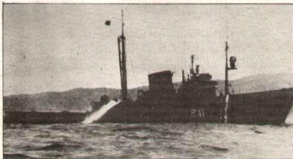
Des pétroliers déversant des milliers de tonnes de pétrole, c'est un accident fréquent. Ici l'Urquiola en mai 1976.

le Torrey Canyon en 1967, l'échouage d'un pétrolier libérien de 237 000 tonnes dans le détroit de Malacca en janvier 1975, l'accident d'un pétrolier grec en novembre suivant, l'incen-