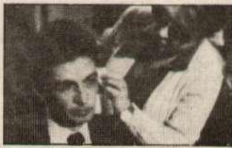
Enrico Berlinguer, leader du P.C.