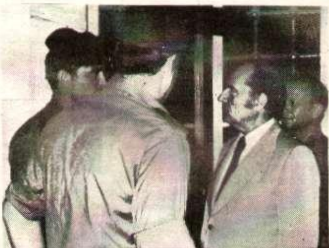
Mitterrand visite l'armée sioniste, «les moyens d'exister» pour Israël !

Et le programme commun ? Les événements nous ont plutôt rapprochés d'une solution positive qu'éloignés (de la solution des divergences PC-PS sur cette question). «Les objectifs commencent à devenir convergents, c'est cela le programme commun de la gauche». Le parti de Marchais et celui de Mitterrand sont de plus en plus d'accord sur un point : la défense commune d'Israël.