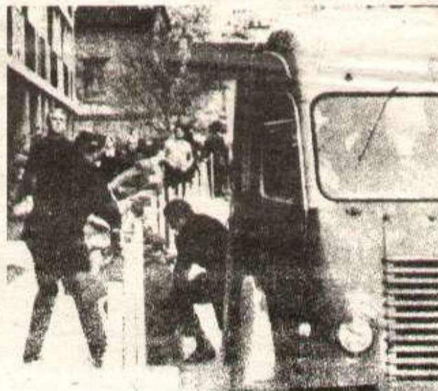
Le camion des saisies

L'assistance est nombreuse, affairée et attentive, jeunes héritiers désireux de meubler bourgeoisement leurs résidences selon les règles du bon goût et de l'ostentation raffinée, antiquaires, collectionneurs, marchands de tableaux ; douairières désœuvrées se pressent devant les bureaux des commissaires-priseurs. Les enchères montent très vite, à peine si l'on devine le léger signe de tête de l'amateur qui fait monter l'enchère de 500 F ou de 1 000 F. En quelques secondes, le tableau proposé est passé de 20 000 francs (mise à prix), à 36 000 francs, ce sera le dernier prix. «Une fois, deux fois, adjudé, vendu !» et les enchères reprennent pour un autre tableau. En quelques heures, il se sera négocié pour plusieurs centaines de millions de francs, à l'Hôtel Drouot.