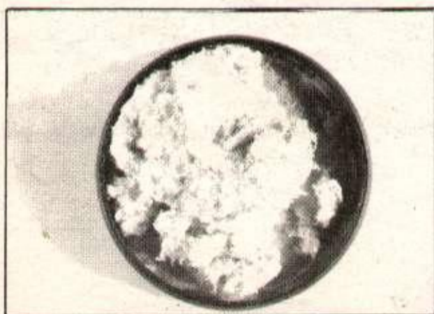
Un échantillon du flochage d'amiante prélevé sur le plafond de la maternelle.

- CLISACT, 56 rue des Guipons, 94 800 Villejuif.