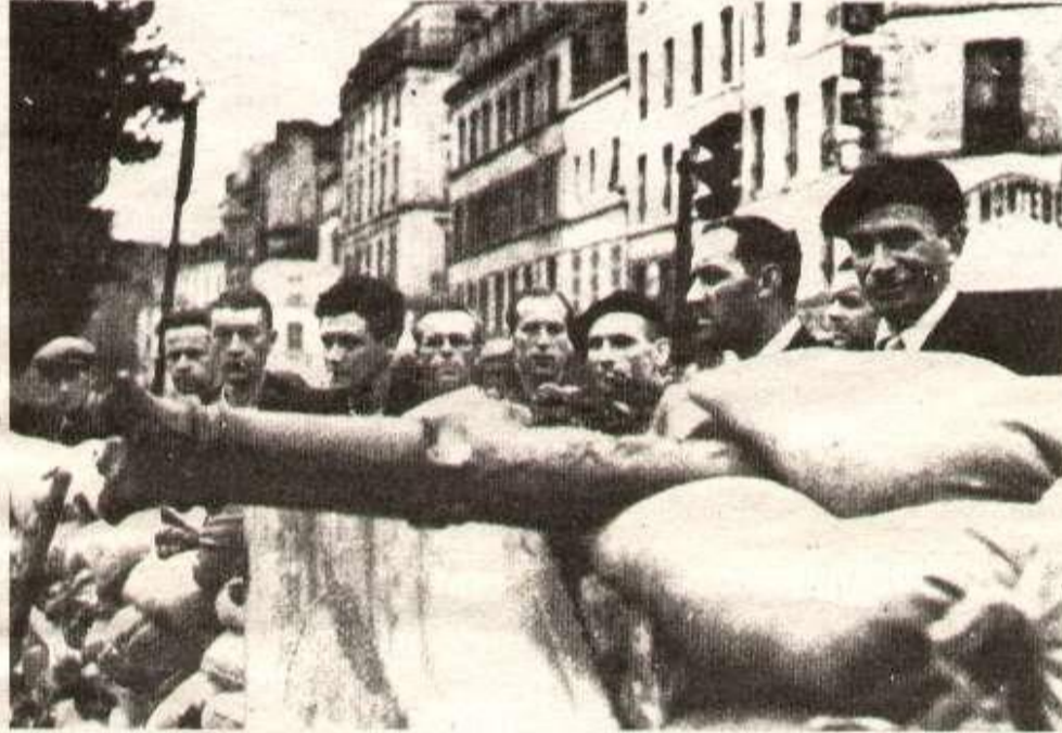
1914 : le peuple de Paris aux barricades