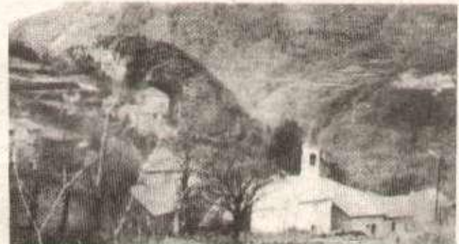
Le village de Sem au-dessus d'Auzat, aujourd'hui presque désert. vivait au rythme de la mine.

Peut-on allier richesses naturelles et agriculture en complément pour permettre la survie de nos villages en toute saison ? Ce