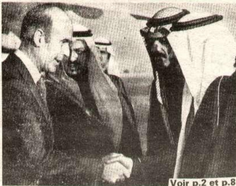
Voir p.2 et p.8

En 1973, l'impérialisme français a inauguré les «nouveaux rapports» qu'il entendait développer avec le Tiers Monde par le voyage en Arabie Séoudite de Jobert, alors ministre des Affaires Etrangères cette nouvelle politique devait jeter les bases du «dialogue» proposé par la conférence Nord-Sud. Aujourd'hui, la conférence a échoué, les «nouveaux rapports» de l'impérialisme français ont été peu fructueux, la marge de manœuvre de l'impérialisme français réduite d'autant. Dans ces conditions, il est peu vraisemblable que les discussions d'Arabie Séoudite redonne à l'impérialisme français des possibilités qu'il a perdues comme intermédiaire entre le second monde et le Tiers Monde. Il apparaît plutôt comme l'intermédiaire entre l'impérialisme occidental regroupé autour des USA et le Tiers Monde.