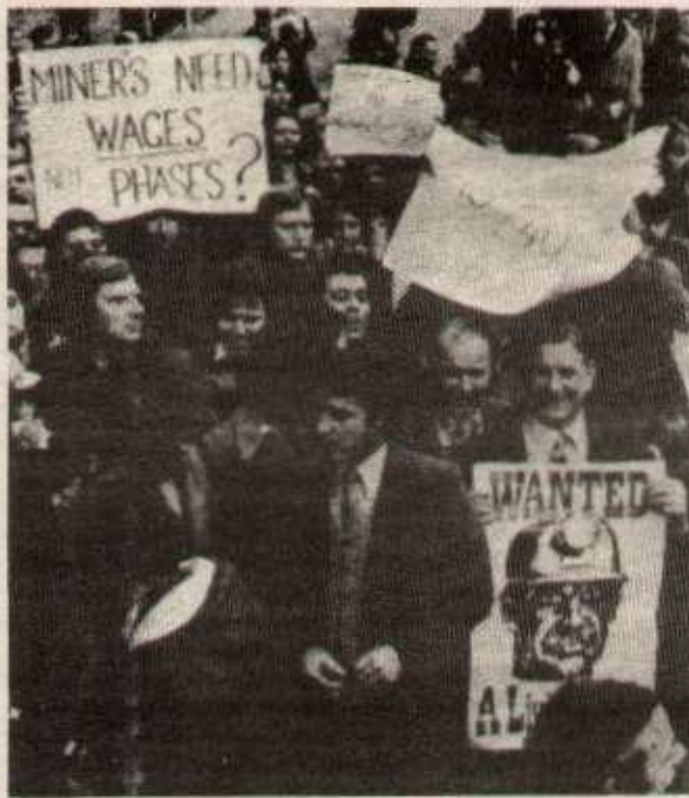
L'opposition dans les T.U.C. du syndicat des mineurs

Ainsi, on le voit, le «Trade Union Congress» est une organisation bien assise, très structurée et qui dans son ensemble ne permet pas une organisation autonome de lutte de classe des travailleurs. Cependant, des syndicats tels que ceux des mineurs, des dockers, des cheminots ont pris en main la lutte pour tenter d'infléchir l'orientation du T.U.C.