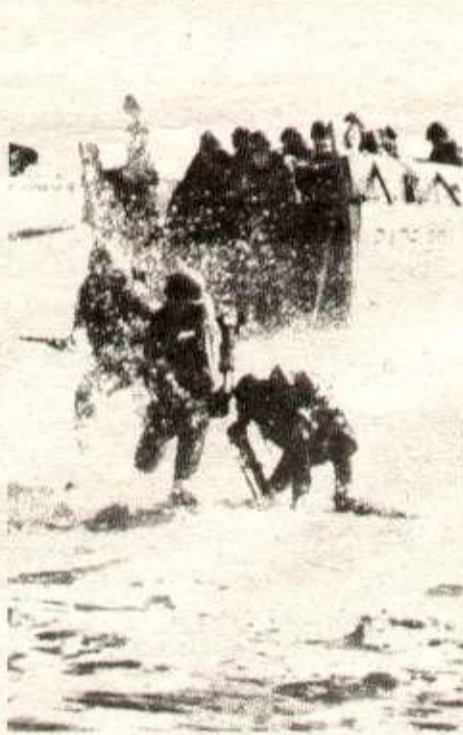
Manœuvres soviétiques au large des côtes de Norvège