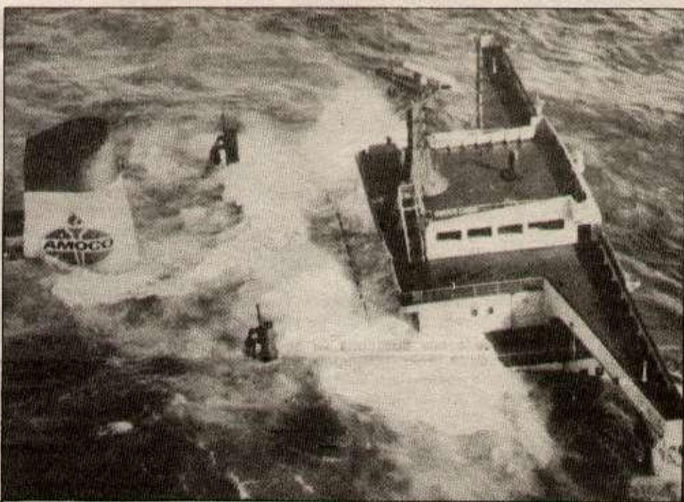
Trop d'irresponsabilités étaient rassemblées pour qu'un «accident» arrive

Pourquoi l'Amoco a-t-il été remorqué initialement vers le Havre? Un sous-marin nucléaire n'était-il pas de retour de mission, pour regagner la rade de Brest? Lorsque c'est ainsi, la marine nationale interdit toute navigation commerciale dans la rade, pendant plusieurs heures. Pourquoi la marine nationale qui suivra de loin toutes les opérations n'interviendra-t-elle pas? Pourtant une loi de juillet 76 lui en fait l'obligation, lorsqu'il s'agit de navires transportant des «hydrocarbures» ou autres