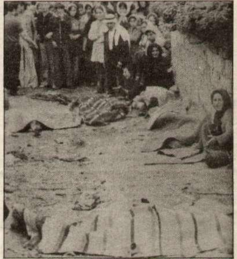
Le massacre de Aytaroun où les enfants furent pris pour cible par l'aviation sioniste. C'était le 12 mai 1975

En montrant leur vrai visage de forces entièrement dévouées à l'impérialisme, les fascistes