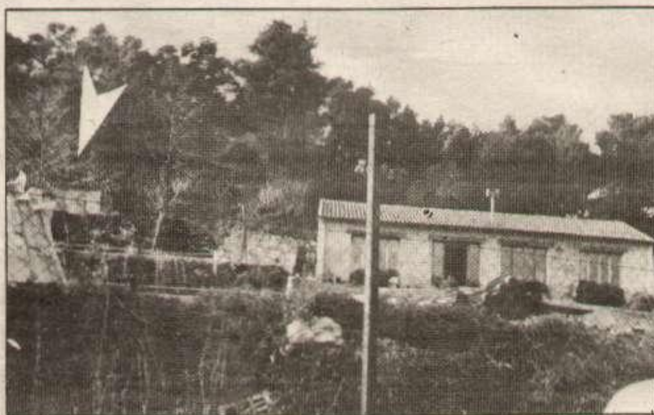
Le bureau : le client doit être agréablement impressionné. Au fond à gauche, l'ancienne porcherie.

Les cycles sont de 7 jours soit 56 h d'affilée et 2 jours de repos au bout du cycle. 2 autres jours de repos sont accordés toutes les 8 semaines.