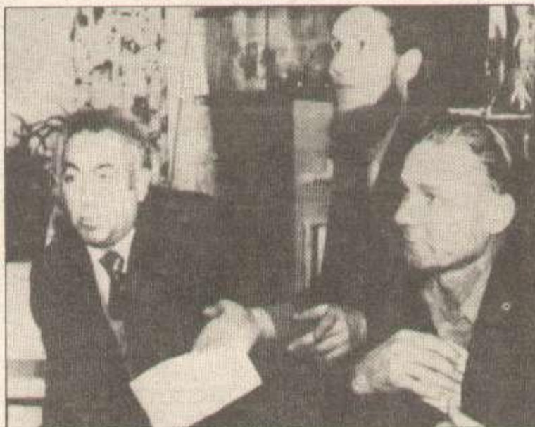
Vladimir Klebanov (à gauche), fondateur de l'Association du syndicat libre de travailleurs en URSS, avec deux de ses camarades, lors d'une conférence de presse à Moscou.

Les autorités soviétiques répondent par la répression : arrestations, emprisonnements, internements en hôpital psychiatrique sans le moindre motif, puisque dans certains cas, les psychiatres se voient dans l'impossibilité d'obéir aux ordres pressants du