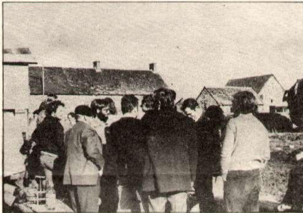
Tour de garde pendant l'occupation de la ferme en 74