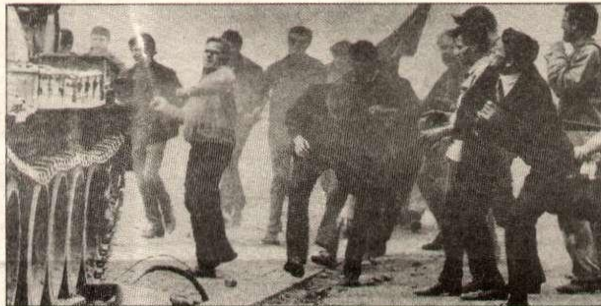
En août 68 : les travailleurs de Tchécoslovaquie se battent contre l'avancée des chars soviétiques

«C'est sur le problème des libertés et de la démocratie que les divergences entre la CGT et les syndicats de certains pays socialistes sont les plus évidentes», affirme un numéro de l'an dernier du Peuple , dans un article intitulé «Réflexion de la CGT sur le rôle des syndicats