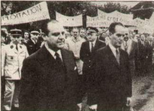
Manifestation syndicale lors d'une visite de Barre en province... avant les élections !