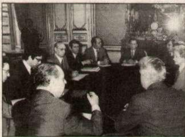
Maire à Matignon : « Les discussions se sont réellement poursuivies de façon approfondie ».