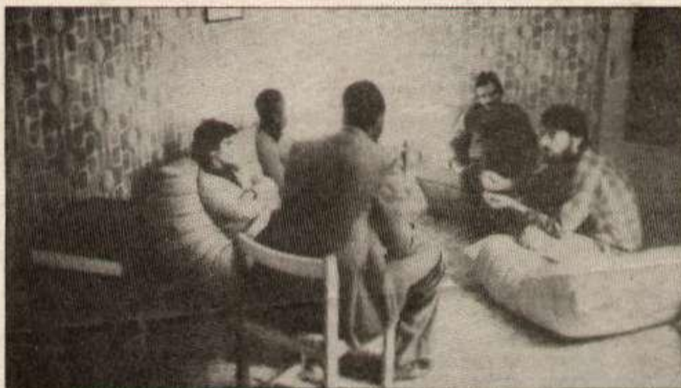
Une réunion de cellule du PCF dans le Val de Marne

Le Quotidien du Peuple Adresse Postale BP 225 75 924 Cédex 19 Crédit Lyonnais Agence ZU 470, compte N° 7713 J CCP N° 23 132 48 F - Paris Directeur de Publication : Y. Chevet Imprimé par IPCC - Paris Distribué par les NMPP Commission Paritaire : 56 942