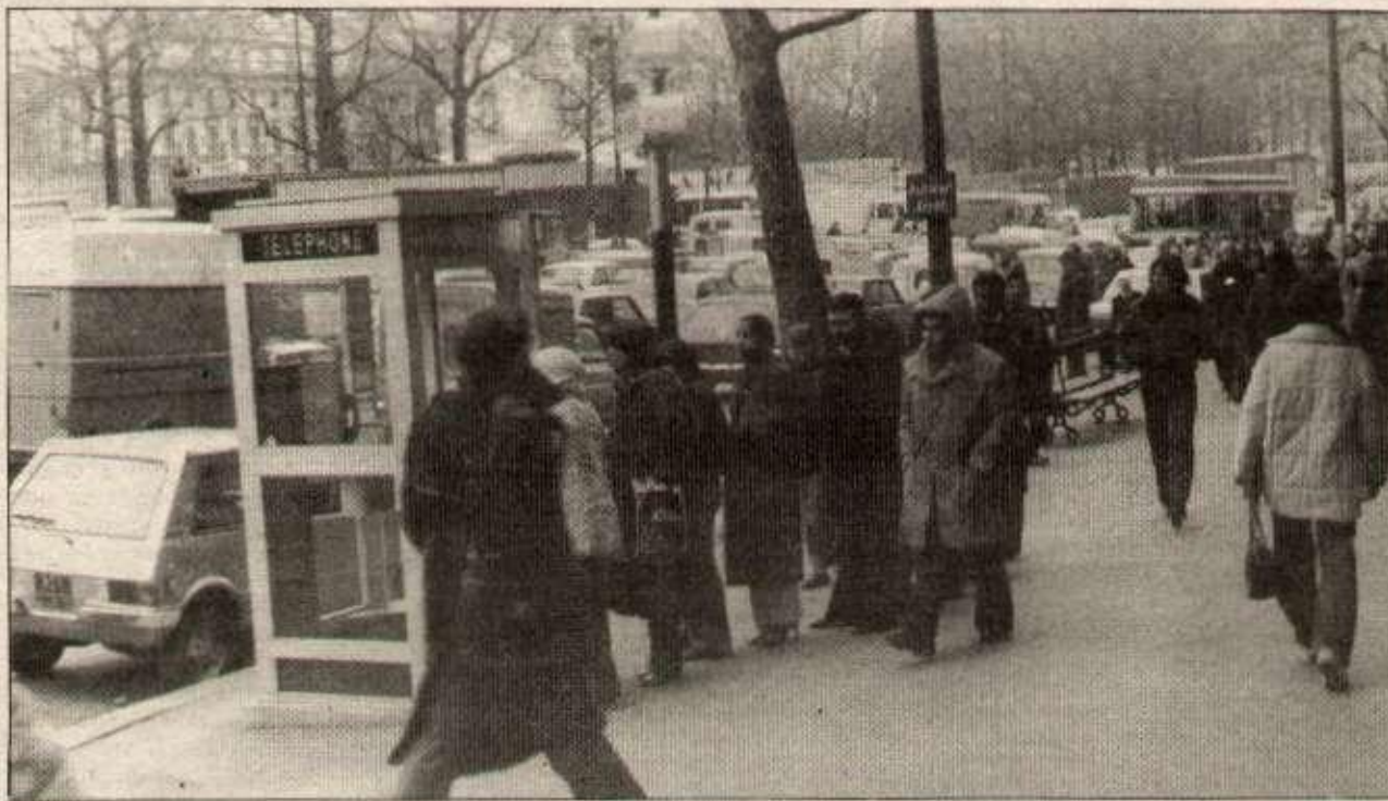
On se bousculait aux cabines téléphoniques, pour prévenir...

Il est sûr que le pouvoir va utiliser les mass-média et l'événement pour faire avancer son objectif politique de tout miser sur le nucléaire. Mais pour nous, il y a une panne réelle et une utilisation politique. Et c'est bien les conséquences d'une politique qui ont produit des incidents techniques.