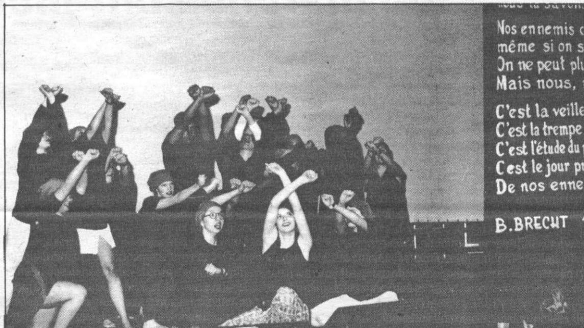
La Révolution sur scène, grâce au groupe "expression" de Rebelle-Bruxelles.