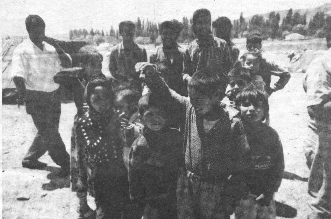
Travailleurs saisonniers à Urfa, ville arabo-kurde au sud d'Ankara. Les villages environnants ont été dépeuplés et rasés. Les réfugiés habitent dans des tentes.

A Ankara, nous avons été reçus par le secrétaire local de l'HADEP, le parti démocratique du peuple, qui nous a raconté que l'année dernière, 1.450 villages kurdes avaient été détruits et 4 millions de personnes déportées. C'est dans cette ville que nous avons découvert un phénomène qui nous a déconcertés : toutes les organisations progressistes se voient obligées de modifier continuellement leur nom et leur adresse, suite aux innombrables procès et tracasseries dont elles sont les victimes. C'est ce qui est arrivé entre autres à l'unique journal de gauche du