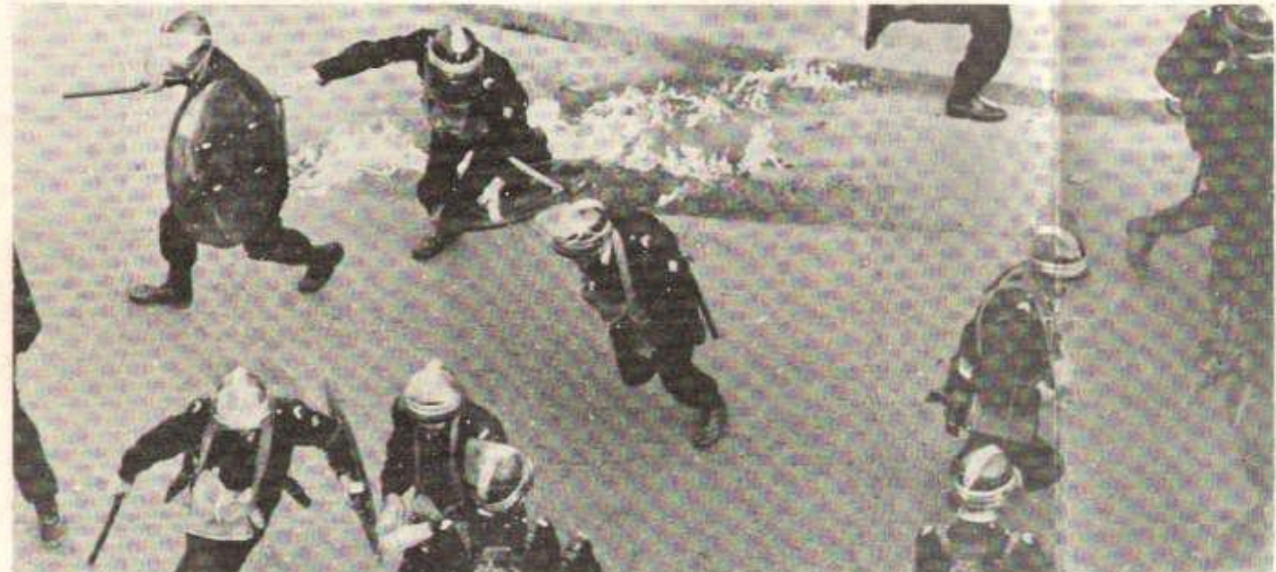
C'est par les armes que le prolétariat brisera l'arsenal policier de la bourgeoisie.

C'est pourquoi les marxistes-léninistes dans les luttes qui éclatent contre l'intensification du travail, doivent clairement révéler le rôle de certaines couches de cadres, dans ce processus d'intensification, démasquer le rôle des révisionnistes dans ces luttes, démasquer la politique des révisionnistes à l'égard de ces couches de cadres.