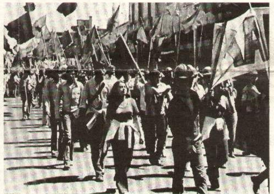
Les masses manifestent à Santiago

C'est pourquoi les travailleurs de notre pays tout en apportant leur soutien au peuple chilien, doivent dénoncer ceux qui citaient