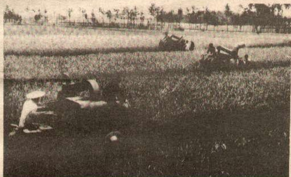
Petites moissonneuses-batteuses au travail dans la province du Setchouan.

L'agence Chine nouvelle a révélé récemment que l'excellente situation du développement de l'agriculture en Chine s'était traduite cette année par une série de récoltes records dans plusieurs provinces, ainsi que de bonnes récoltes dans les régions touchées par la sécheresse et autres calamités naturelles.