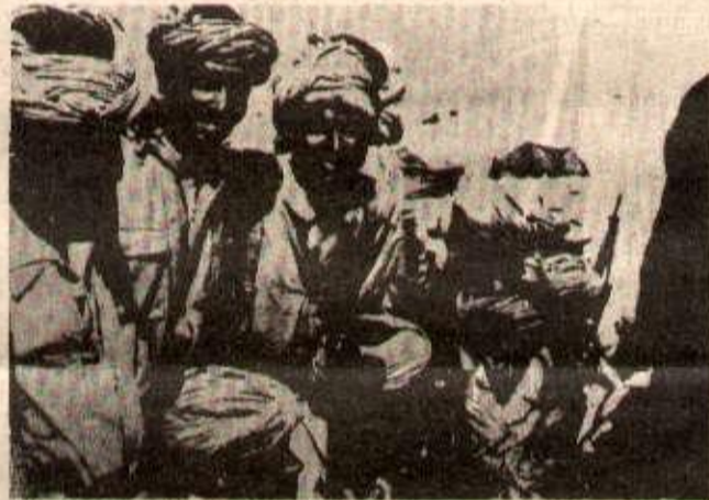
Une unité militaire du F. POLISARIO.

C'est pourquoi, au printemps 1974, l'URSS et le Maroc ont conclu un accord visant à la fourniture à court terme de 3 à 5 millions de tonnes de phosphates à l'URSS, à moyen terme de 10 millions de tonnes et plus.