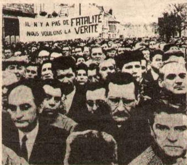
Lors des obsèques — 43 de leurs camarades sont morts — chez les travailleurs, derrière la douleur, c'est la colère qui gronde.

Ils étaient quarante-trois quarante-trois qui ne connaissent que la nuit pour que d'autres voient le jour Ils étaient quarante-trois quarante-trois que la nuit a happés soudain que la mine a gardés fiévreusement au creux de ses veines d'encre Quarante-trois mineurs une centaine d'orphelins quarante-trois des meilleurs fils de notre peuple arrachés à la vie au nom du rendement et du profit Ah qu'on ne dise pas c'est la mine qui a tué c'est le grisou on n'y peut rien Qu'on ne dise pas il faut attendre les résultats de l'enquête Ils sont quarante-trois quarante-trois qui vous accusent impitoyablement inébranlablement éternellement quarante-trois mineurs qui vous montrent du doigt vous les magnats de la finance vous les requins de l'industrie vous les politiciens bourgeois de droite ou de «gauche» vous les serviteurs du capital quarante-trois mineurs vous désignent du doigt qui hanteront vos rêves aujourd'hui demain après-demain jusqu'au dernier de vos jours qui déjà sont comptés Ils sont quarante-trois qui comptent vos jours les derniers un à un lentement inexorablement inébranlablement