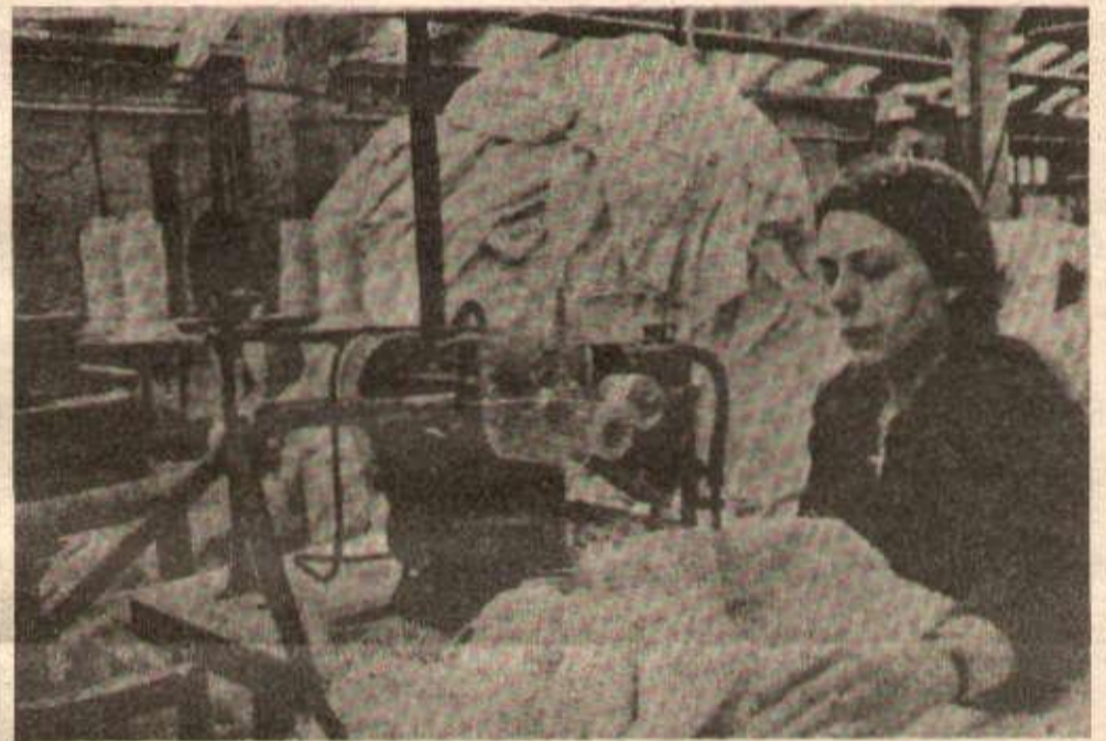
La popularisation est souvent décisive dans une lutte. C'est pour mieux populariser leur lutte que les ouvrières de la COFAL ont repris la production.

syndiquée au départ. Elles ont monté une section CFDT où toutes se syndiquent. Un Comité de soutien est créé pour faire connaître la lutte des ouvrières de la COFAL. Avec la tenue de meetings, de galas de soutien, la rencontre avec