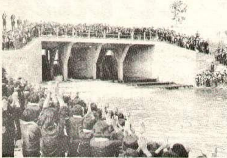
Inauguration d'un barrage dans le Sud-Ouest du Cambodge, travail dans un atelier d'une usine de caoutchouc... deux images du Cambodge nouveau que nous venons de recevoir.

Après sa grande victoire dans la guerre de libération nationale le peuple cambodgien redouble d'efforts pour réparer et reconstruire le pays dans l'esprit d'indépendance et de compter sur ses propres forces.