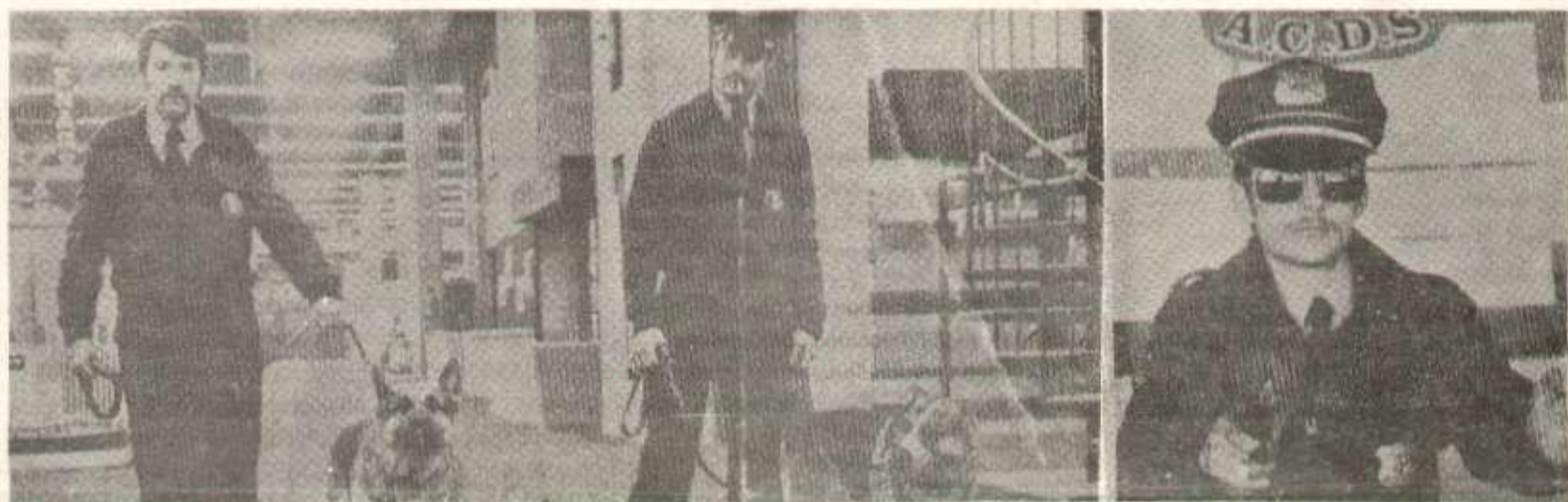
Les maîtres-chiens de l'ACDS au travail.

Ainsi l'ACDS est une entreprise de mercenaires qu'emploie quiconque veut réprimer des travailleurs à condition de pouvoir payer, aussi bien les capitalistes que ... les révisionnistes.