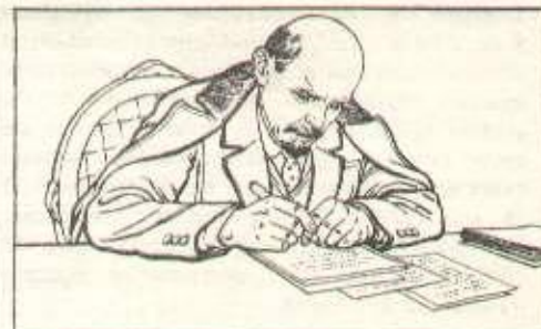
117) A Pétrograd, la révolution armée a triomphé. Au cours de la révolution, Lénine, Staline et les autres membres du Comité central ont conduit ensemble la révolution, organisé les forces révolutionnaires et appliqué les règles urgentes du pouvoir des Soviets. Lénine dresse le célèbre décret «sur la paix» et «sur la terre», et continue la lutte afin de consolider le pouvoir de la dictature du prolétariat.