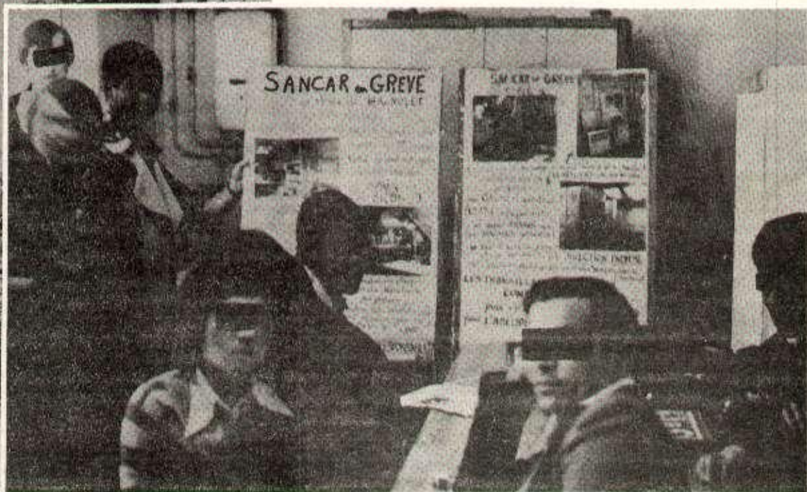
La détermination et l'union des grévistes de Sancar (Paris 20ème), a payé : le patron a dû céder sur les revendications (voir H.R. No 362). Sur notre photo, la conférence de presse de jeudi dernier.