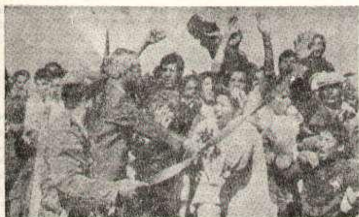
Maroc : des soldats marocains fouettent les marcheurs dirigés vers le Sahara. Voilà qui montre sous son vrai jour le caractère «populaire» de la marche des «volontaires» d'Hassan II.