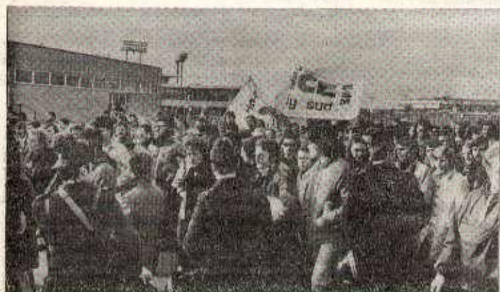
Lundi matin, les CRS ont été envoyés contre les grévistes d'Air-France qui occupaient des ateliers et des bâtiments administratifs à Orly.