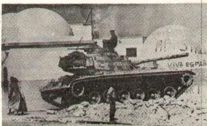
Le régime franquiste, lui non plus, n'est pas prêt à reconnaître le droit à l'autodétermination du peuple sahraoui. Son armée effectue des préparatifs fébriles pour être en mesure de préserver ses intérêts colonialistes au Sahara.