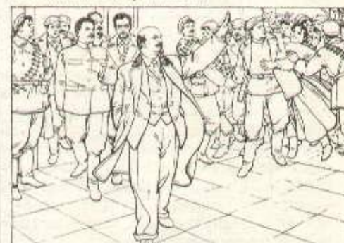
118) Le deuxième congrès de tous les membres des Soviets a lieu à l'institut Smolny. Quand Lénine, Staline et les autres camarades partent du bureau du Comité militaire révolutionnaire pour aller assister à une réunion, la foule les acclame et crie sans cesse des «Hourrah !»