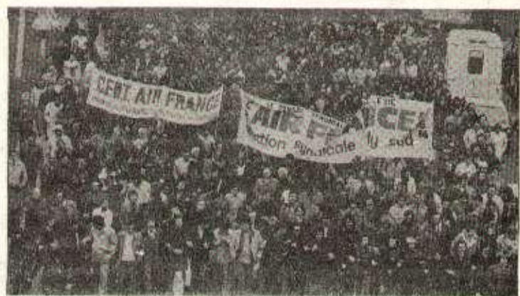
Révoltés par cette agression, les grévistes sont allés manifester leur colère et leur détermination sur la RN 7 (AFP).