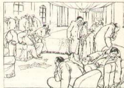
115) Le chef du gouvernement provisoire Kérénski s'est déjà sauvé dans une voiture de l'ambassade américaine. A ce moment, les «seigneurs-ministres» savent que dans cette situation ils ne peuvent qu'être éliminés et vont se cacher dans les profondeurs du Palais d'hiver, l'air abattu dans un désordre complet.

L'instruction ouverte après l'accident aboutit tout d'abord à un non-lieu, mais les familles des victimes, parties civiles, firent appel. L'enquête reprit avec le concours de trois experts qui, dans leurs conclusions, estimèrent que la responsabilité de la direction était engagée, les cadences étant, selon eux, trop intensives dans l'usine, et les mesures de sécurité insuffisantes.