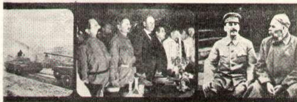
« Révolution ! » No 100 du 27 juin 1975 : bande photographique publiée en tête d'une page présentant des résolutions de son III e Congrès. Au centre : Trotsky... mais pas Lénine !