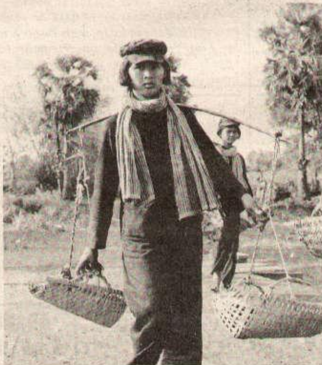
Les femmes cambodgiennes des forces armées de libération participent à la bataille du riz.

Au lendemain de la libération, le pays était ravagé, détruit, un champ de ruine. Mais le pouvoir populaire s'était forgé dans l'adversité. Il savait pouvoir s'appuyer sur son peuple, un peuple démuné de tout, mais politiquement conscient et en armes. Et le problème le plus urgent, celui des vivres, a été résolu par le nouveau Cambodge en préservant son indépendance et sa dignité.