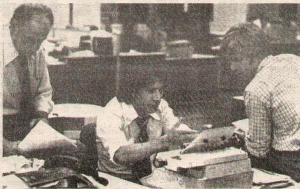
«Les hommes du président» : tout dire... sauf ce qui remettrait en cause le capitalisme.

Ces images ont été récemment reprojettées au 16e congrès de la Société française de Criminologie, réuni à Caen. Abordant la question du rôle des médias (radio, presse, télé), le congrès put