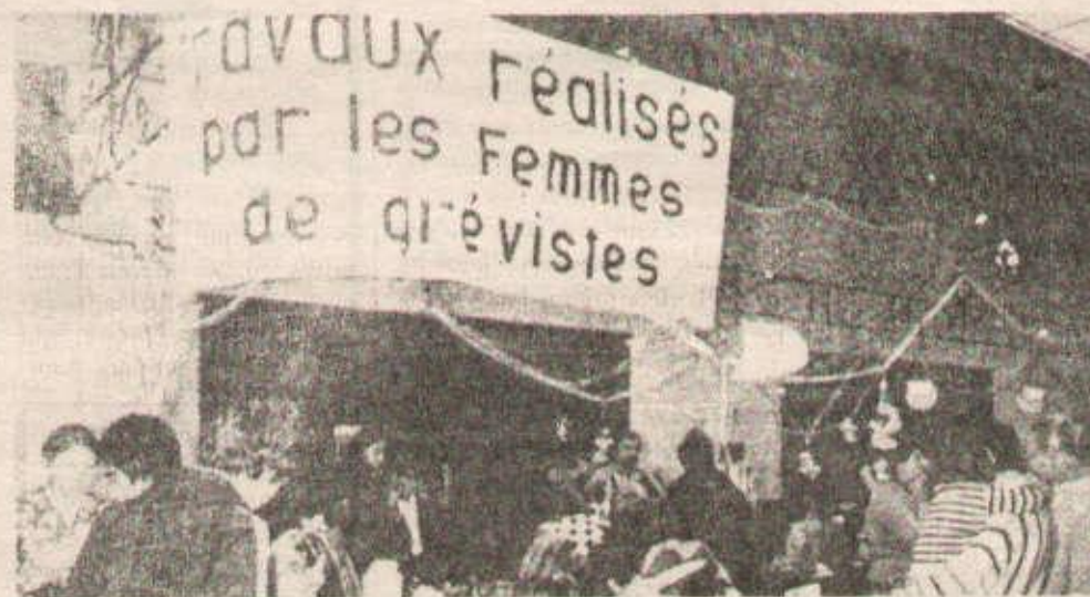
Aux Assises du nucléaire, stand des femmes des grévistes de l'usine de la Hague.

Pour un quotidien, toujours mieux en mesure de faire connaître le point de vue marxiste-léniniste, de mieux servir la classe ouvrière et ses luttes, en avant vers les 25 millions !