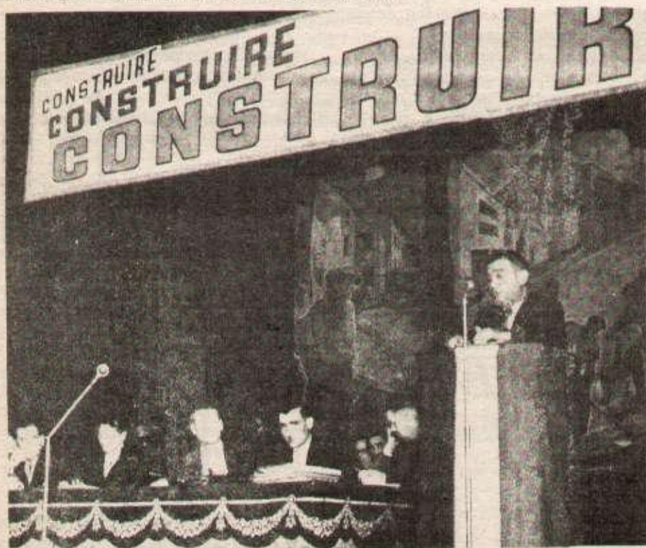
A la tribune du Congrès CNL de 1946, François Billoux, ministre communiste de la reconstruction. Peu après avoir lancé le mot d'ordre figurant à la tribune, la CNL participait aux conseils d'administration des HLM.