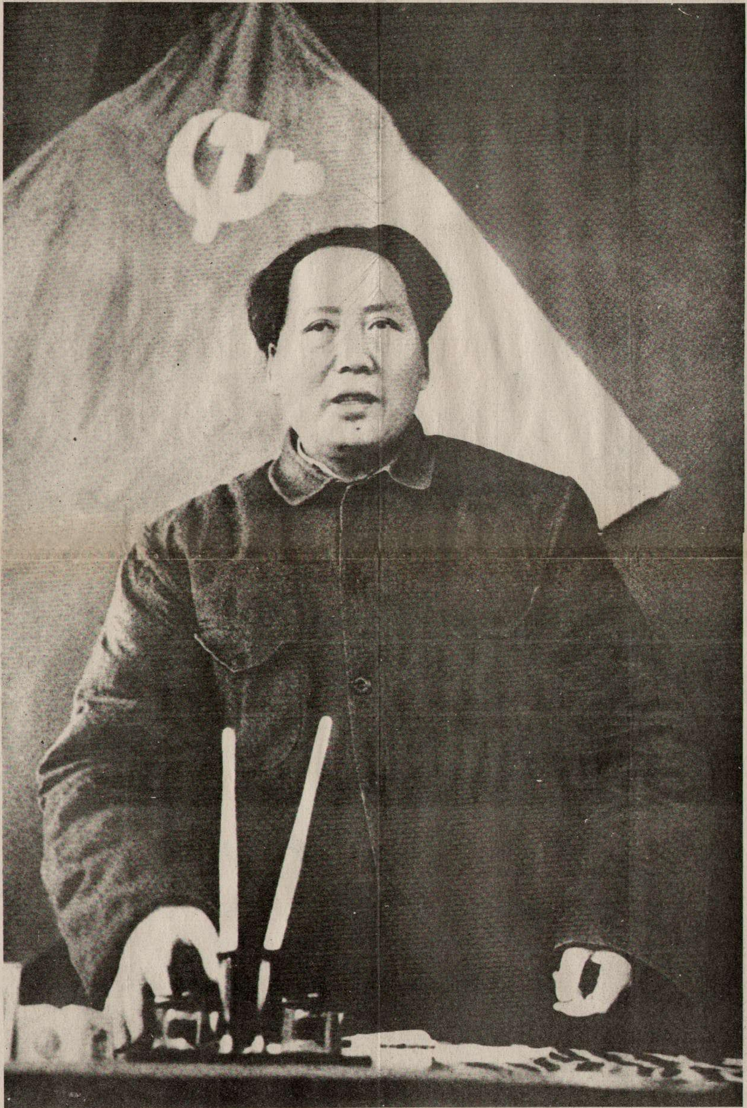
Mao Tsé-toung, le plus grand marxiste de l'époque contemporaine (26 décembre 1893-septembre 1976)