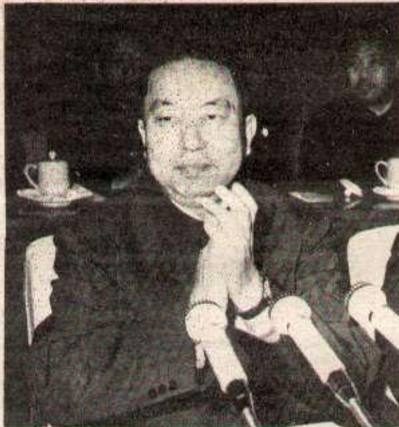
Le président Houa digne continuateur de l'œuvre révolutionnaire dont le président Mao fut le pionnier en Chine.

Puis le président Houa a développé les principales tâches de combat que l'année 1977 réserve au parti, à l'armée et au peuple tout entier et qui peuvent se résumer ainsi :