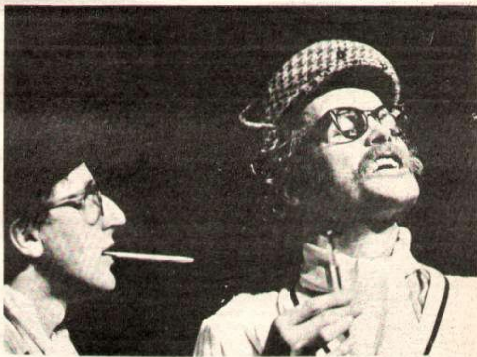
Séquence sur Lip : «Les moustiques technocrates».

HR — Est-ce que votre travail a consisté à retranscrire théâtralement et poétiquement ce qui ressortait de vos enquêtes, ou avez-vous, vous-mêmes, dégagé l'orientation politique ? Cette question surtout à propos de la «viabilité» des usines fermées (et aussi dans la recherche d'un nouveau patron) et du thème de l'autogestion qui apparaît dans plusieurs scènes.