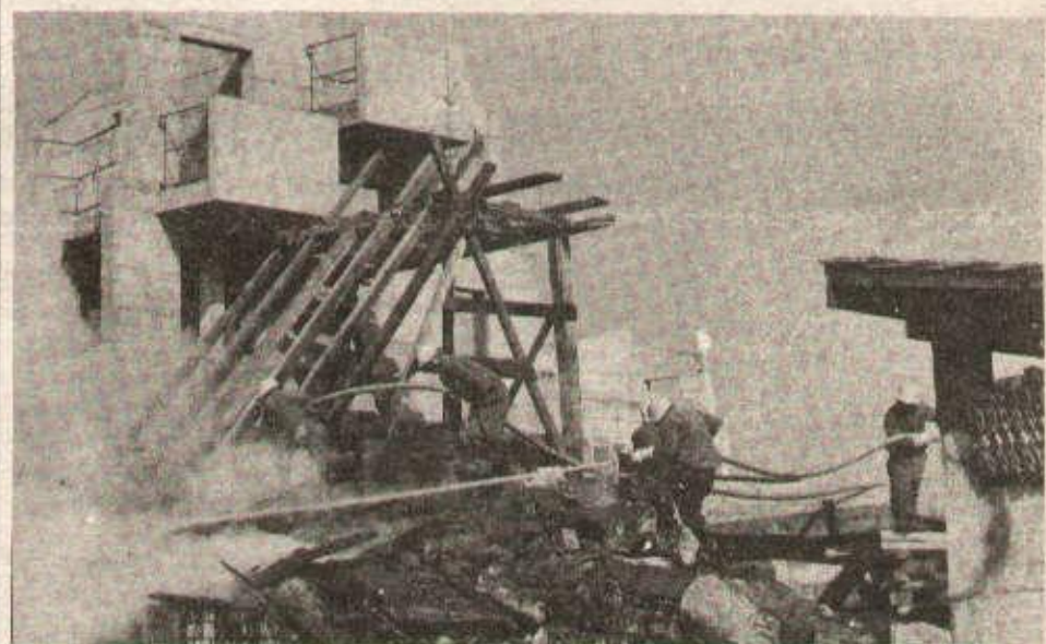
A Sempach, près de Lucerne, les membres de la défense civile s'entraînent à éteindre l'incendie dû au bombardement des avions ennemis au cours d'une manœuvre.

Face à la dispute fiévreuse qui met aux prises en Europe les deux superpuissances, et en particulier à la menace militaire du social-impérialisme, la Suisse attache une grande importance à sa défense civile. Jusqu'en 1975, elle avait des abris pour accueillir quatre millions et demi de