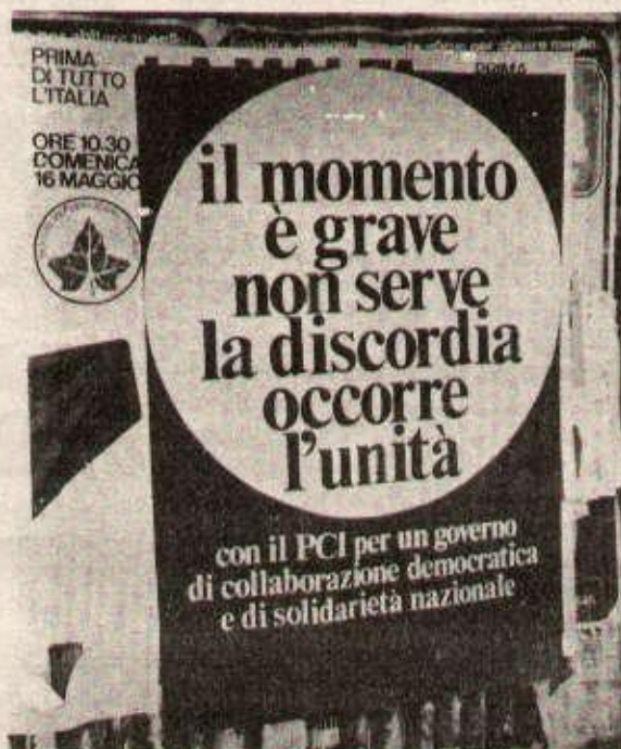
Une affiche électorale révisionniste : Avec le PCI... pour la collaboration... de classe !

C'est ce qui explique qu'une grande partie des masses populaires, véritablement révoltées par la démocratie chrétienne et trompées par les promesses électorales, s'appête à voter pour le PCI mais aussi qu'une partie non négligeable de la démocratie chrétienne se soit prononcée pour l'alliance avec lui d'autant plus que cette alliance laisse entrevoir l'ouverture encore plus grande de marché d'Europe de l'Est aux produits industriels et agricoles de l'Italie.