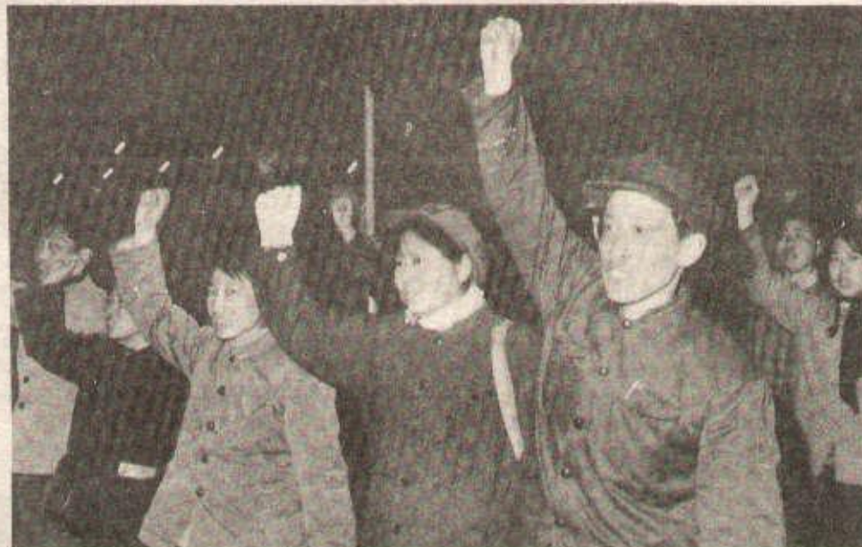
Les enseignants et les étudiants de l'université de Pékin manifestent leur soutien au Comité central et au président Mao à la suite de l'incident contre-révolutionnaire de la place Tien-an-men.

« Oui, en renversant les propriétaires fonciers et la bourgeoisie, nous avons déblayé la voie au socialisme, mais nous n'en avons pas bâti l'édifice. Et sur le terrain où une génération a fait place nette, on voit constamment paraître dans l'histoire des générations nouvelles, pourvu que la terre enfante, et elle enfante des bourgeois à profusion. Et ceux qui considèrent la victoire sur les capitalistes du point de vue des petits propriétaires "ils ont empêché, maintenant c'est notre tour !" donnent naissance à une nouvelle génération de bourgeois ».