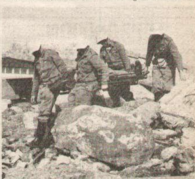
Entraînement des membres de la défense civile : à sauver les blessés à Sempach près de Lucerne.

On dit souvent aux soldats de ne pas croire aux nombreux traités et accords signés après la seconde guerre mondiale, car certaines de leur clauses vides de sens ne parviennent pas à camoufler la sévère réalité actuelle. La Suisse a tiré cette conclusion de la dernière guerre mondiale :