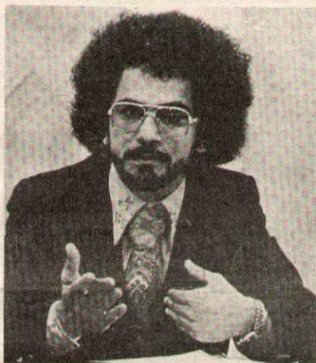
José Ramos Horta secrétaire général du FRETILIN.

MINISTRE DES AFFAIRES ETRANGERES DE LA REPUBLIQUE DEMOCRATIQUE DE TIMOR-ORIENTAL