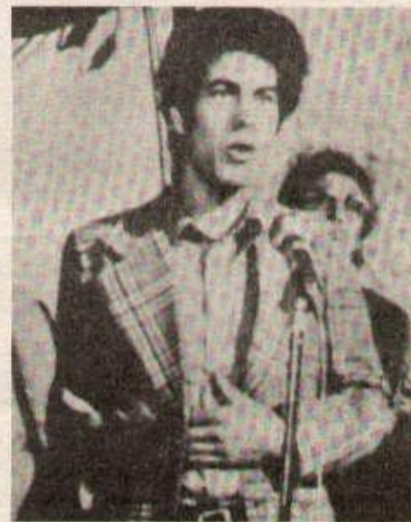
Une réunion-débat parmi d'autres (photo l'Algérien en Europe).

« La Révolution agraire, dira un autre, nous a appris qu'il peut y avoir aussi la création d'une classe nouvelle de bureaucratie et de bourgeois. » Un travailleur soulignera avec force : « Nous sommes contre la bourgeoisie nationale sous toutes ses formes et à tous les niveaux. Il faut exprimer des problèmes vécus, avec force et à tous les niveaux : « Il faut