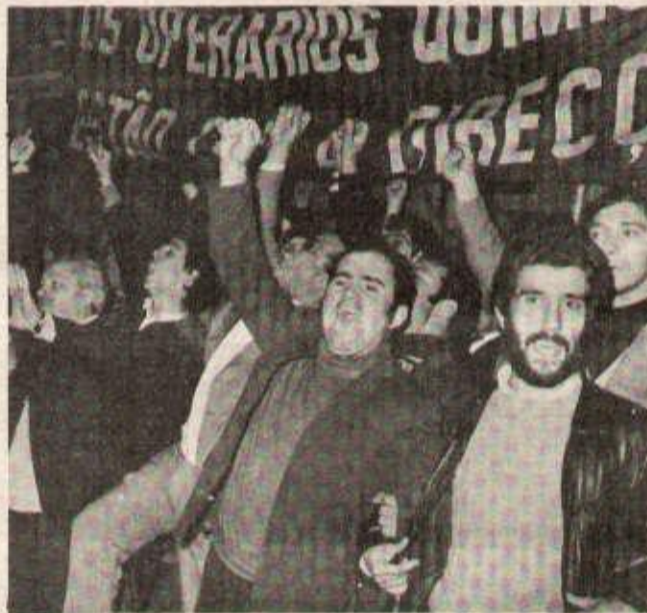
Le peuple portugais a fait l'expérience du social-fascisme. Ci-dessous, une manifestation des ouvriers de la Chimie contre l'Inter-syndicale du PCP.

Au Portugal, qui a été l'objet d'une offensive politique du social-impérialisme particulièrement nette, la vigilance demeure contre les menées de ses agents dans le pays, pour consolider l'indépendance et la démocratie sans sacrifier pour autant les revendications légitimes de la classe ouvrière et du peuple pour l'amélioration de ses conditions de vie.