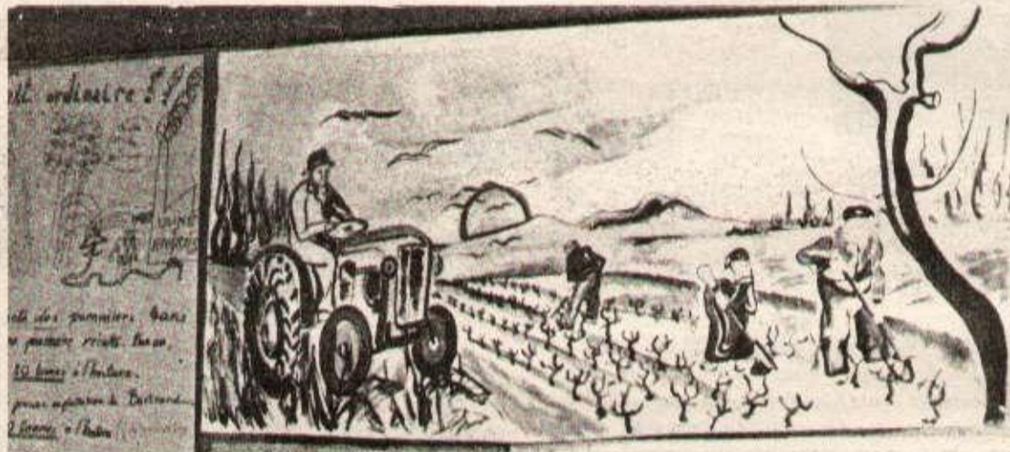
(1) — Fresque illustrant la vie des petits paysans. (photo HR). (2) — La troupe de l'Olivier d'Aix-en-Provence monte l'occupation par les travailleurs de Griffet du bateau d'Alain Colas — ici c'est l'inauguration du bateau par Gaston Deferre (à gauche) (photo HR). (3) — Dessin donné aux travailleurs de Griffet au cours du Rassemblement.