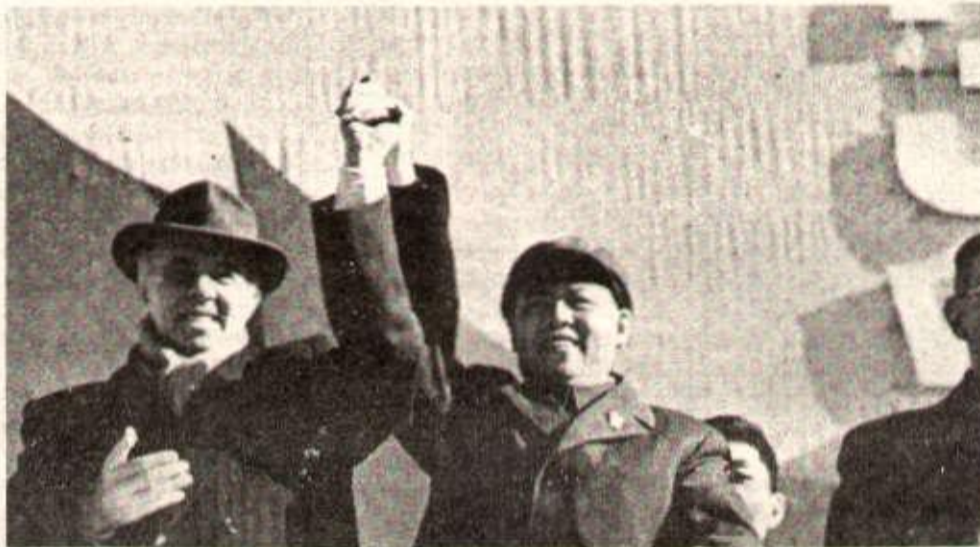
Lors des fêtes marquant le 30 e anniversaire de la révolution albanaise, Enver Hoxha et le représentant du Parti communiste chinois, Yao Wen-yuan.

Depuis quelques temps une campagne est orchestrée dans les pays capitalistes et révisionnistes pour faire croire à un affaiblissement des liens de solidarité militante entre le Parti du Travail d'Albanie et le Parti communiste chinois. Le camarade Enver Hoxha vient de dénoncer vigoureusement cette campagne au cours d'une rencontre cordiale et amicale qu'il a eue avec les représentants des ouvriers et des techniciens albanais et chinois du Combinat métallurgique d'Elbasan en cours de construction.