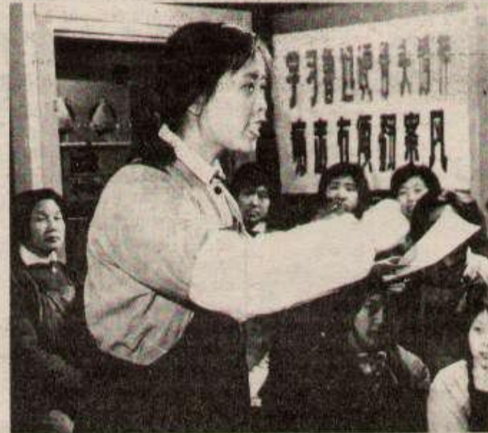
Dans toute la Chine, de nombreuses réunions politiques ont préparé la commémoration du Premier Mai.

Le soir, de magnifiques feux d'artifice étaient tirés en divers points de la capitale brillamment décorée de lanternes et de banderoles.