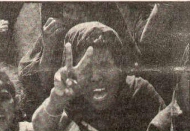
Sûres que le peuple sahraoui remportera la victoire.