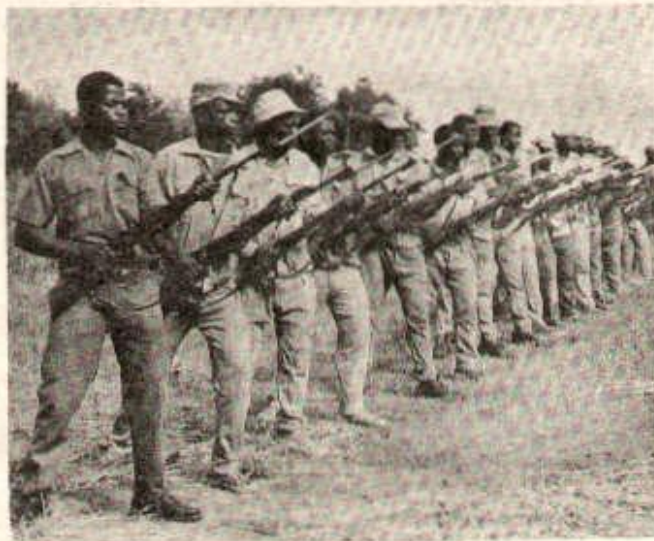
Combattants du FRELIMO à l'entraînement

A ce sujet, Joshua N'Komo, dirigeant du ZAPU, une des composantes, avec la ZIPA, du Front patriotique, a déclaré que c'était à cause de la guerre de libération que menent les patriotes et non à cause d'une « manne qui tombe du ciel » que la Conférence de Genève avait lieu. Il est difficile de préjuger des résultats de cette Conférence à cause de l'intransigeance du raciste Smith et des manœuvres des impérialistes US qui le soutiennent. Cependant les mouvements de libération ont déjà fait savoir que, de toute façon, leur lutte ne cessera qu'avec la libération totale de leur pays et l'installation au Zimbabwe d'un gouvernement africain.