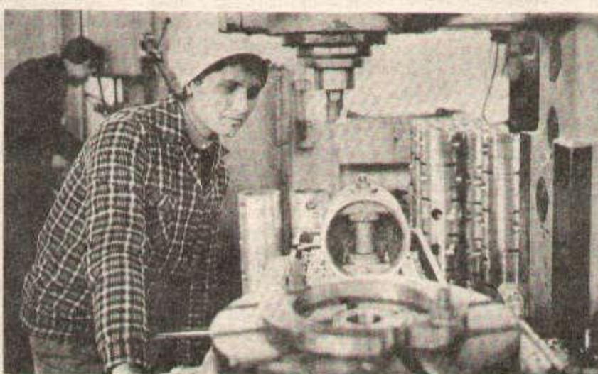
Un principe de base pour aller de l'avant : «Compter sur ses propres forces».

Les trois premières séances ont été consacrées à la lecture du rapport d'activité du Comité central du PTA présenté par Enver Hoxha. Dans l'après-midi du 2 novembre, le congrès a écouté le rapport d'activité de la commission centrale de contrôle et de révision du plan. Le rapporteur a souligné que les communistes albanais travailleront de toutes leurs forces pour appliquer les décisions du 7 e Congrès. En général, les tâches fixées au congrès précédent ont été bien appliquées dans tout le pays. La période écoulée depuis le 6 e Congrès a été caractérisée par une activité politique intense des organes et des organisations de base du parti. Le parti a grandi idéologiquement et s'est renforcé organisationnellement. Au centre de l'attention des organisations de base a été mis l'élevation du niveau qualitatif des membres et des organisations du parti pour réaliser avec succès les difficiles tâches qui leur ont été présentées. Les commu-