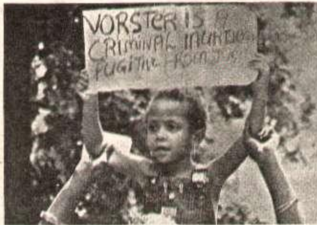
Aux USA, les Noirs américains dénoncent les crimes des racistes sud-africains.

Ce nouveau crime des racistes ne restera pas sans réponse à Soweto où se préparaient déjà d'importantes manifestations contre les mesures d'interdiction décrétées le 19 novembre dernier contre une vingtaine d'organisations antiapartheid, et pour la libération de 50 de leurs responsables et militants arrêtés le même jour et toujours détenus sans jugement.