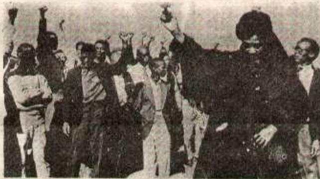
La douleur engendre la colère et la résistance.

A cette fin, les États-Unis donnent donc tout le soutien politique et diplomatique à la RAS. Cette activité traîtresse va presque sûrement s'accroître et poser de graves problèmes à notre lutte dans un proche avenir, quand la guerre du peuple engloutira la RAS dans la bataille finale.