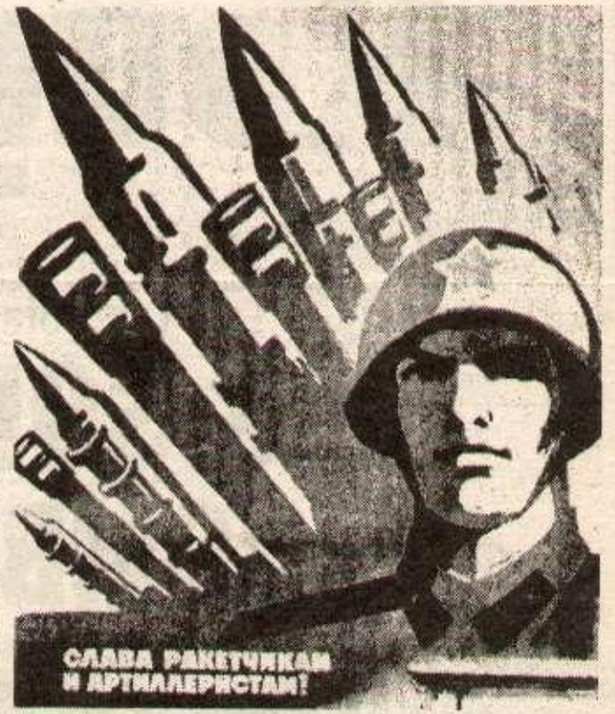
Affiche russe qui révèle bien la militarisation du pays.

Pendant que cette poignée de bureaucrates se vautre dans le luxe, les travailleurs manquent de tout. Plus de la moitié des kolkhoziens et près d'un cinquième de la population urbaine vivent au-dessous du niveau d'indigence officiel. Les sociaux-impérialistes soviétiques, face au rétrécissement du marché intérieur, que leur rapacité provoque,