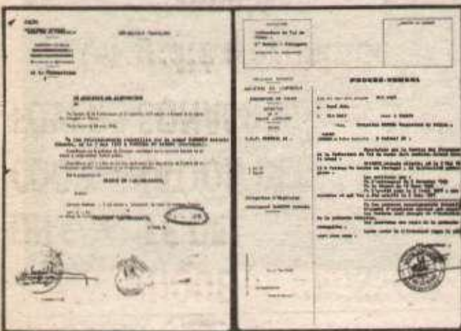
PHOTOCOPIE DE L'ARRETE D'EXPULSION DU PROCES-VERBAL ET DE L'ANNULATION DE L'ARRETE D'EXPULSION

Quant au PCF, il voudrait se faire passer aujourd'hui pour plus à gauche que le PS! Mais les travailleurs de LIP se souviennent qu'il n'y a pas si longtemps encore, ce sont bien les dirigeants du PCF qui les traitaient de «provocateurs irresponsables» quand ils décidaient de produire, de vendre et de se payer. La nouvelle tactique du PCF ne trompe personne.