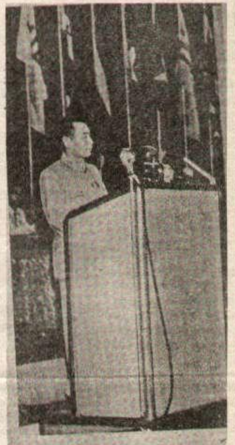
Le camarade Chou En-lai à la Conférence de Bandung en 1956. Il y déploya un travail énorme, en soutien aux luttes des peuples du tiers monde.

Désormais, dans toutes les assises internationales, les pays qu'on nomme du « groupe des 77 », vont préciser leur stratégie à l'égard de l'Europe, des USA — mais aussi de l'URSS. Les affrontements vont se multiplier : à Genève en mars 75, sur le « droit de la mer » ; à Lima sur les minerais ; à la session de l'ONU sur le développement, en septembre 75 ; enfin dans toutes les réunions préparatoires à la Conférence Nord-Sud.