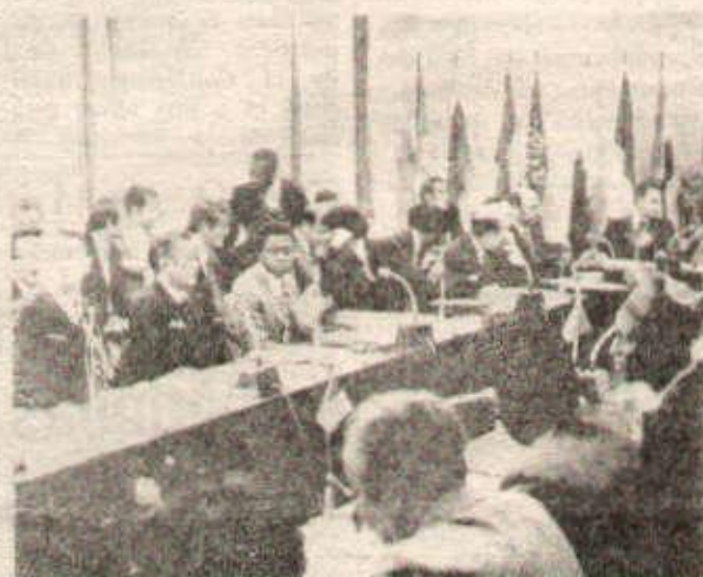
L'unité croissante du tiers monde porte de rudes coups à l'impérialisme : ici une conférence de l'OPPEP à Vienne en 1974.