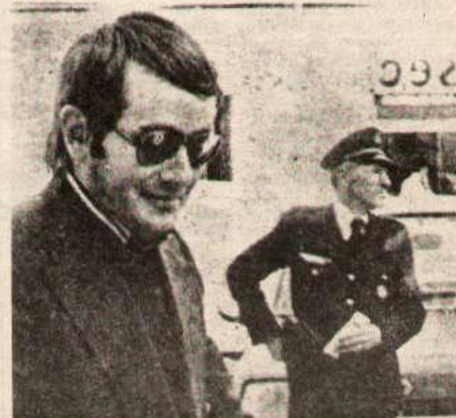
Spaggiari, auteur du casse de Nice, militant fasciste d'extrême-droite, court toujours, après son évasion pour le moins surprenante...

basé sur cette violence quotidienne qu'est l'exploitation de l'homme par l'homme, la répression, le chômage et la misère.