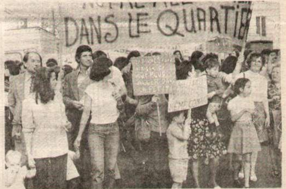
Sur la banderole : «Nous sommes à la rue, nous exigeons notre relogement dans le quartier.» Derrière les familles, à gauche, on peut voir les zélus du PCF ; ça y est, ils sont presque en tête !

«J'ai tenté de faire un biberon entre deux flics en civil qui gardaient la cuisine. Ils m'ont arraché mon sac pour prendre les clés. Pendant 2 h 1/2, ils m'ont pratiquement séquestrée, empêchant tout contact avec les habitants. Ils ont menacé de me retirer les enfants. Ils m'ont insultée violemment lorsqu'ils ont compris que je n'accepterais pas le relogement aux portes de Paris : j'étais une mère indigne, une irresponsable.»