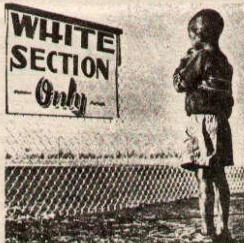
«Section pour blancs seulement» : la ségrégation raciale commence dès l'enfance.

Cette atmosphère de crise, on la retrouve avec le re-