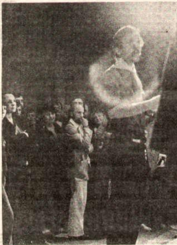
Derrière le chef d'orchestre de la chorale «La Lyre des travailleurs» une partie de la nombreuse assistance.

L'appel à la souscription pour le journal fait partie de l'ensemble de notre combat politique. Il est lié directement à notre action militante dans les usines et les quartiers, au sein des syndicats et dans le domaine culturel.