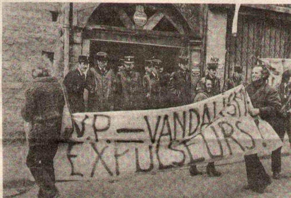
Les habitants du Marais montrent la voie de la résistance aux expulsions.

Lundi après-midi, le préfet de police indiquait que 1627 expulsions avaient été effectuées à Paris entre le 1er avril et le 31 août cette année. Plus des trois quarts d'entre elles ont pour origine le non-paiement des