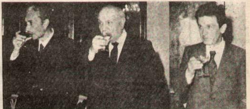
Aldo Moro (Démocrate-chrétien), Francesco De Martino (socialiste), Enrico Berlinguer (PCI). Le compromis historique : une trahison des principes marxistes-léninistes.

ception matérialiste et scientifique du monde. Celui-ci doit condamner et lutter pour que les conceptions idéalistes soient rejetées