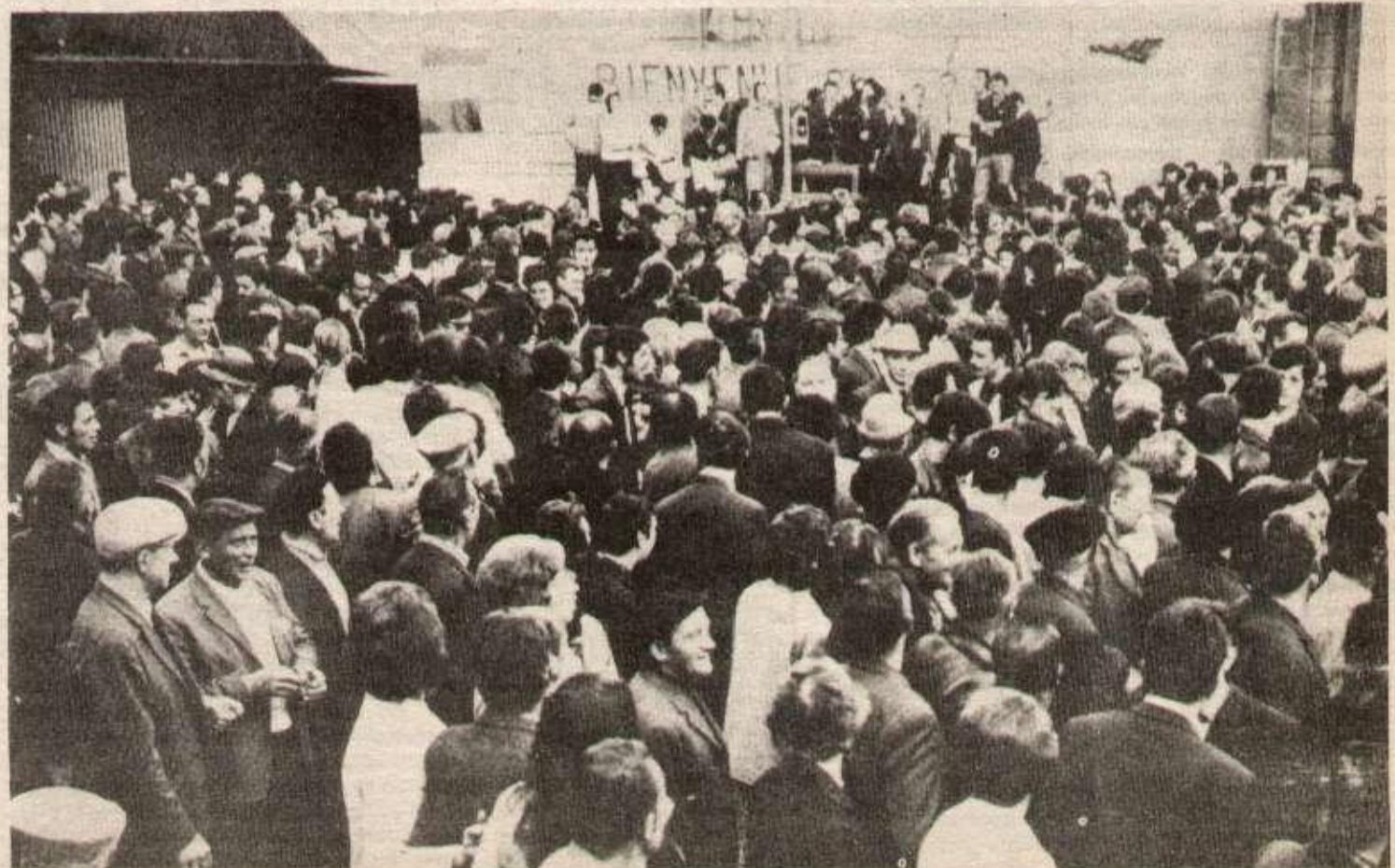
Manufrance en janvier 1968 : l'occupation de l'usine.

A Manufrance, il existe un courant de lutte de classe, un courant anti-révisionniste que les marxistes-léninistes se doivent d'organiser. C'est ce à quoi ils vont s'attacher dans les mois et les années qui viennent.