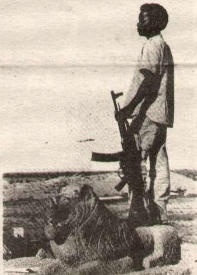
Un combattant du Front de libération somalien de l'Ogaden.

Cette offensive de grande envergure, bénéficiant de gros moyens militaires, ne parvient toutefois pas à remporter des succès militaires décisifs, puisque le FLSO indique que depuis le début de celle-ci, « l'ennemi » a perdu 43 chars, 3 MIG et de nombreux soldats ont été mis hors d'état.