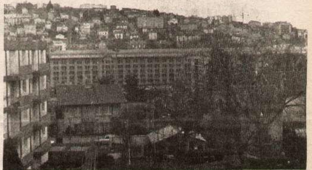
Une vue des ateliers de Manufrance