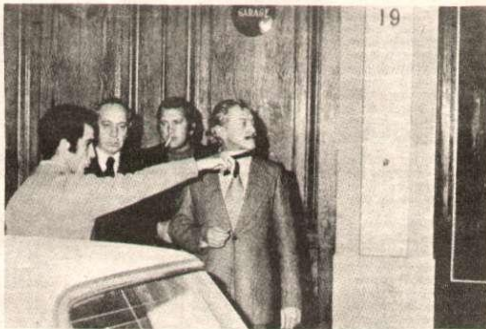
Le juge Renaud inquiétait par ses enquêtes certains milieux de la bourgeoisie. Il a été supprimé.

Le pouvoir n'a en fait nullement l'intention de mettre fin à une criminalité étroitement liée à certains milieux qui le touchent de très près. Lorsqu'il prétend vouloir la combattre, c'est en fait pour se préparer à une répression accrue contre les travailleurs et pour justifier la violation de sa propre légalité comme lors de la fouille des voitures.