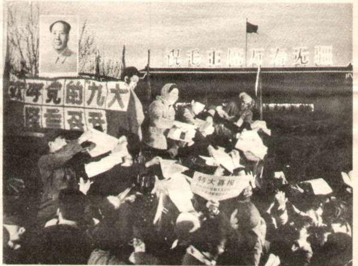
Le peuple tout entier étudie et discute les affaires de l'État

R : Elle unit la répression et la clémence, la réforme par le travail forcé et l'éducation idéologique ; elle éduque le plus grand nombre, réduit la cible de l'attaque et donne à chacun une chance.