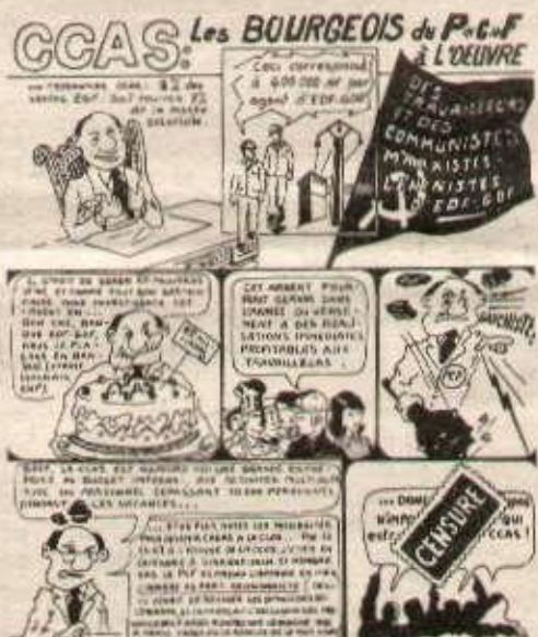
Bande dessinée réalisée par les travailleurs de l'EDF-GDF pour dénoncer les pratiques des dirigeants CGT et PCF dans les CCAS. Extrait de la brochure réalisée par l'Humanité rouge « Quand ils sont au pouvoir ».

Il ne faut se faire aucune illusion sur les dirigeants du PCF. Ce qui se passe à la CCAS, grande entreprise au budget de 60 milliards d'anciens francs, montre leur vrai visage, ce que serait le PCF à la tête de l'État bourgeois. Et montre aussi ce que veulent faire des syndicats révisionnistes : des instruments du capitalisme d'État pour encadrer les travailleurs, leur faire se retrousser les manches pour le plus grand profit des patrons de « gauche ».