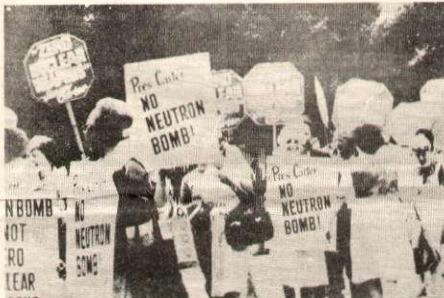
Manifestation contre la bombe à neutrons aux États-Unis devant la Maison Blanche. Mobilisons-nous contre les préparatifs de guerre.

- faire grandir le courant d'amitié avec les pays socialistes du monde, bastions de la révolution prolétarienne mondiale.