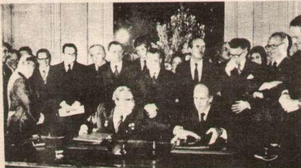
Giscard pense aux profits juteux, mais c'est l'économie de guerre russe qu'il renforce.