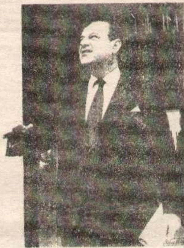
C'est cet homme-là qui fait coller partout sur les panneaux publicitaires de grandes affiches avec ces deux seuls mots : « Barre confiance ». Vous, la voyez-vous, la confiance ?

(*) Marchais précise même que son coiffeur est « hautement qualifié... sans doute pour éveiller la jalousie de Raymond Barre.