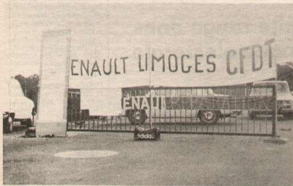
Grève chez Renault en octobre 1975.

Dans notre région, il est très difficile de trouver du travail : aujourd'hui, 1 200 chômeurs cherchent un emploi et les jeunes sont particulièrement touchés (les moins de 25 ans représentent la moitié des demandeurs d'emploi). Vivre et travailler au pays est pour nous un mot d'ordre qui nous touche de près et qui permet de contester l'ordre capitaliste : par exemple, aux PTT, c'est le départ massif des auxiliaires vers la région parisienne.