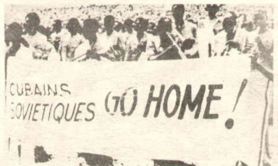
« Cubains, Soviétiques, dehors », manifestation antisocial-impérialiste en Afrique.

Le peuple de France, comme tous les peuples d'Europe qui ont connu les souffrances de deux guerres mondia-