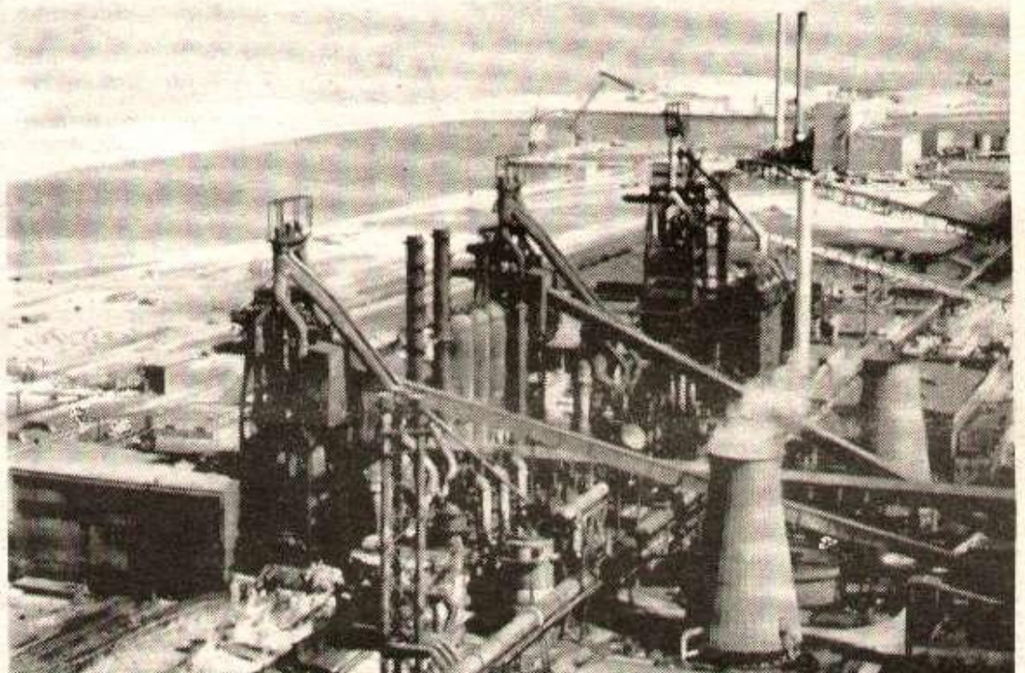
Les installations d'Usinor-Dunkerque. Actuellement 7 à 8 000 travailleurs sont lock-outés.

Dans l'édition datée de vendredi, nous publierons le programme des journées de solidarité avec les sidérurgistes, organisées par le PCML à Dunkerque et à Denain les 29 et 30 avril, ainsi qu'une première liste des délégations ouvrières qui y participent