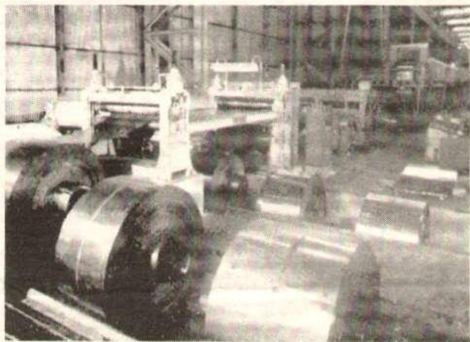
Un atelier à Usinor-Montataire.