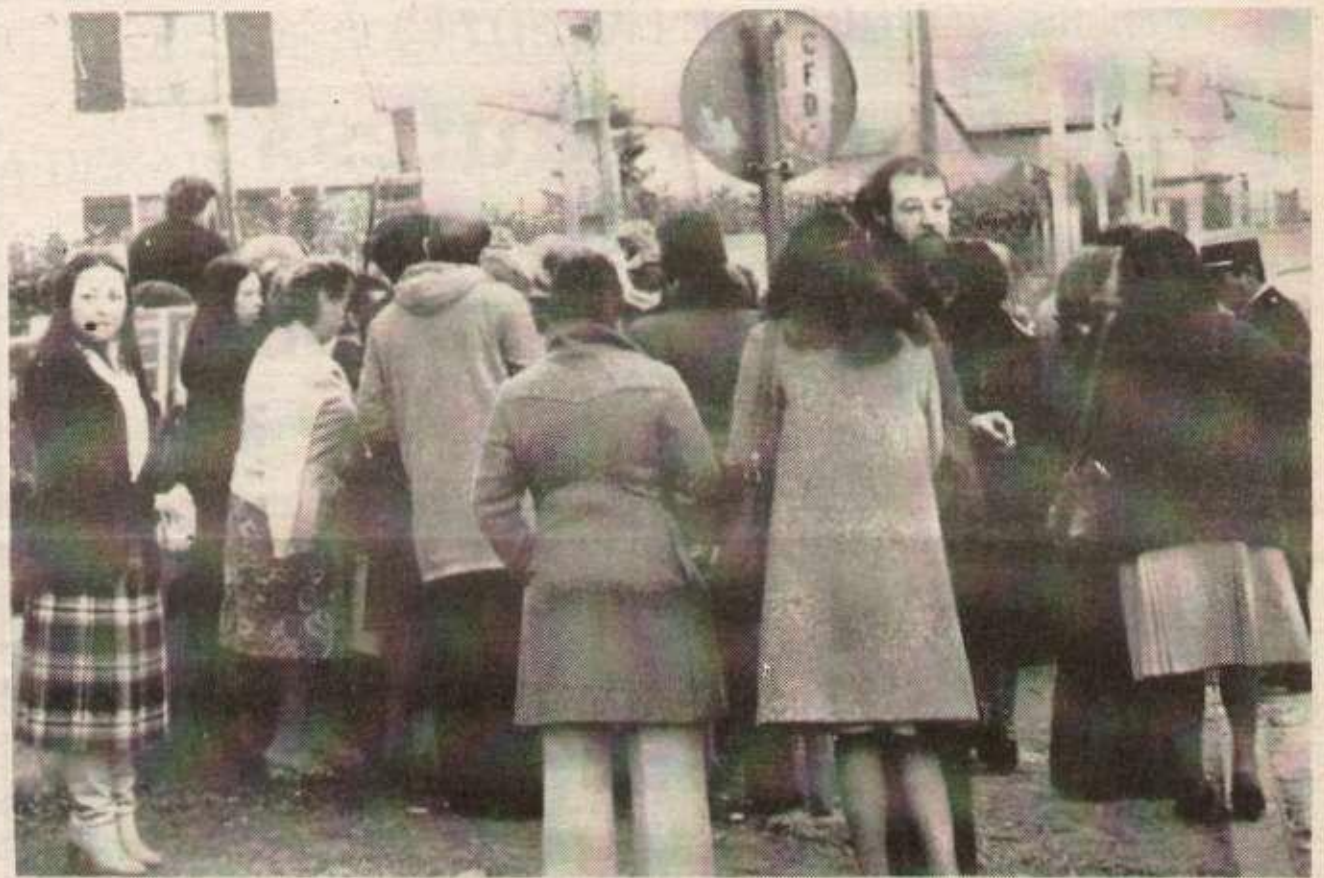
Au piquet de grève de la Spiram : les dernières tentatives pour convaincre les non-grévistes. (Photo HR).

La situation actuelle d'attaque générale du gouvernement et du patronat et les difficultés pour la riposte, c'est ces idées là qu'il faut faire avancer, qu'il faut mettre en pratique pour que l'unité des travailleurs progresse, et pour que des victoires soient possibles.