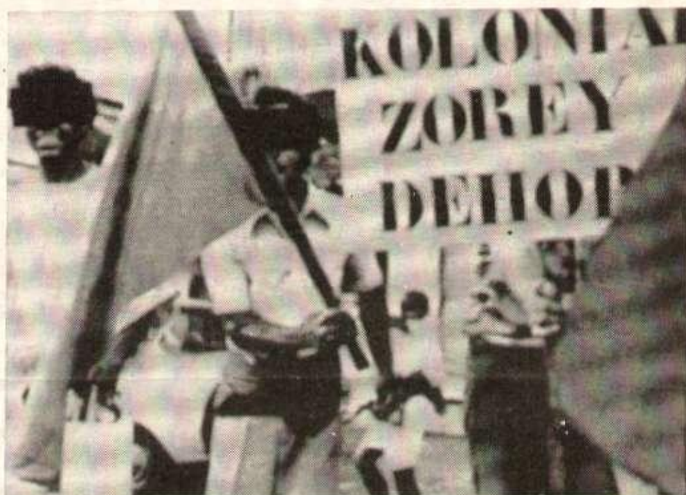
Mars 1978 : manifestation pour l'indépendance à la Réunion.

La Réunion vue par Marchais : une partie de la France qu'il faudrait protéger par des réglementations spéciales dans le cadre du marché commun