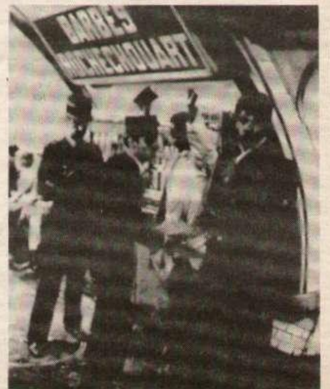
Fouille dans le métro à Paris.

Ce témoignage est tiré du Patriote guadeloupéen, organe central de l'Association générale des étudiants guadeloupéens. (AGEG 85, Rue Beaubourg Paris 3e)