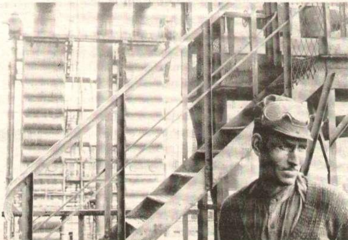
Dans les emplois les plus durs et les plus mo-

Le seul moyen de déjouer ces manœuvres, c'est de s'organiser et dénoncer toutes les mesures qui aboutissent à une forme de marchandage entre les pays concernés, sur le dos des travailleurs. J'appelle tous les compatriotes, tous les travailleurs immigrés à s'organiser de façon disciplinée pour faire face à ce qui va à l'encontre de leurs intérêts de travailleurs.