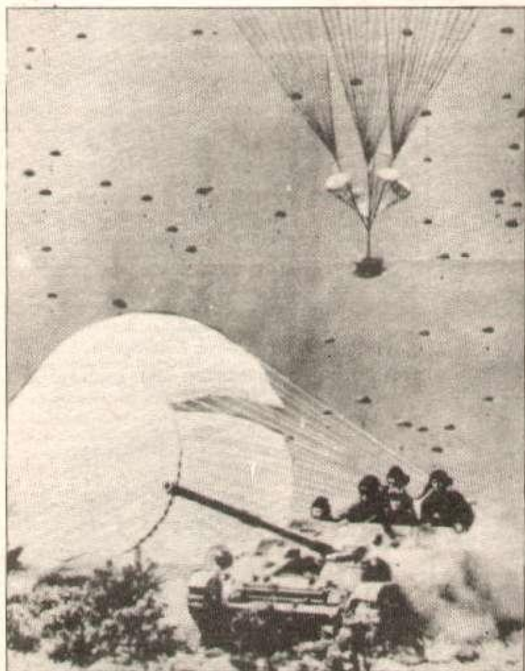
Les troupes aéroportées soviétiques