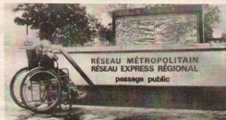
Les transports: un problème pour tous les handicapés physiques. Ceux de Grenoble ont entamé la lutte.

En riposte les résidents appellent à un meeting le vendredi 26 janvier à 20 h 30, à la fac de droit, Rue de Serre à Nancy et à une manifestation le samedi 3 février.