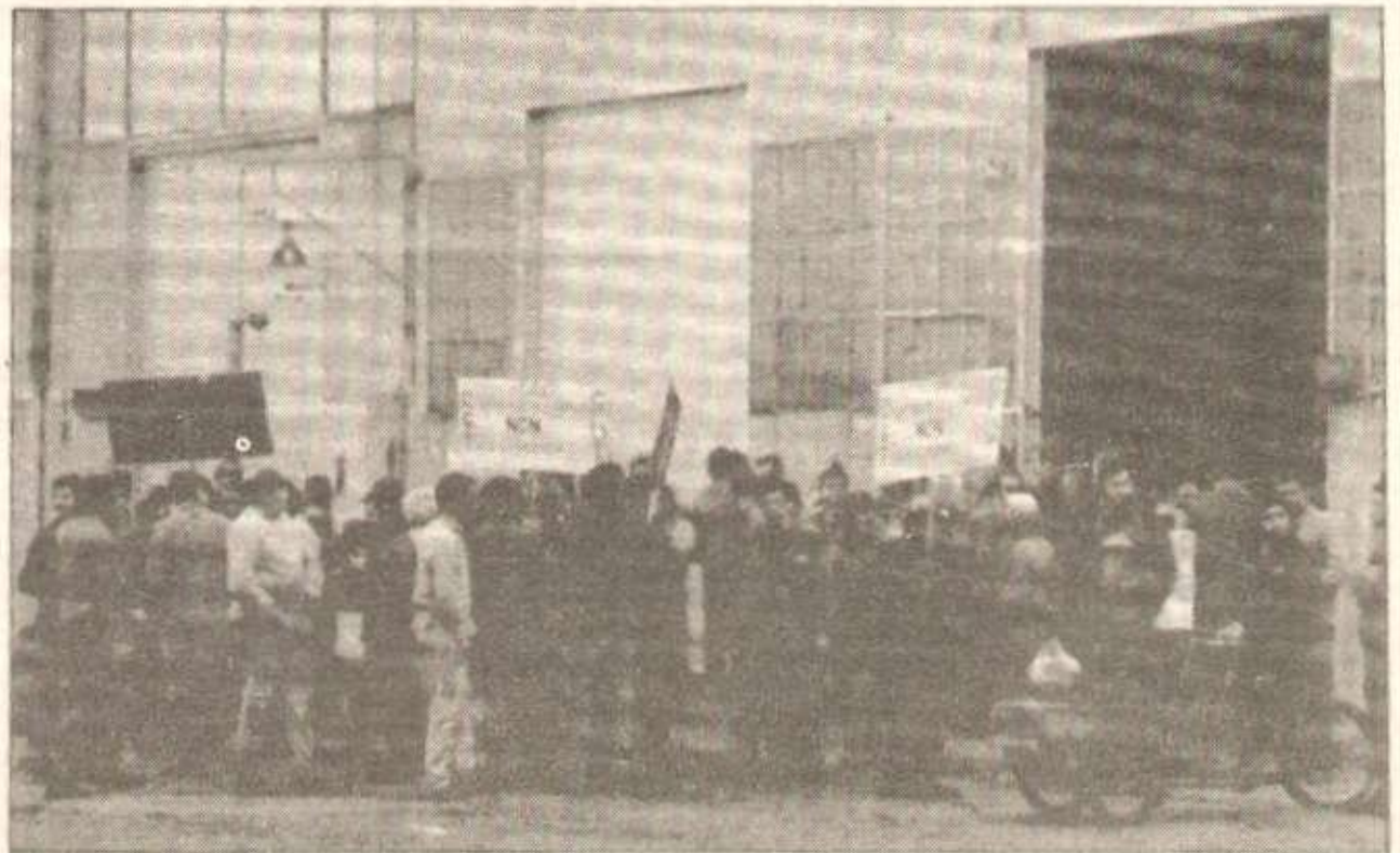
Contre les cent quarante licenciements prononcés par Renault dans sa filiale la Société nationale des ateliers de Vénissieux (SNAV), les travailleurs occupent leur usine.