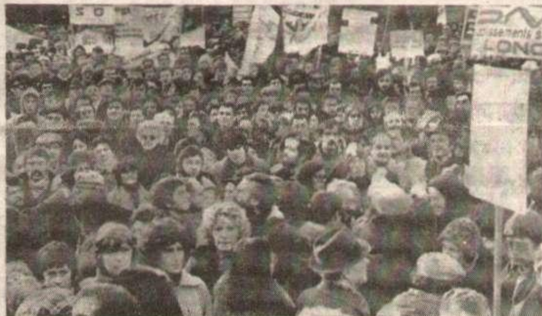
La seule voie efficace pour obtenir des emplois, c'est la lutte. Ici, les travailleurs de Lorraine l'ont entamée

I L aura suffi d'un jour pour réduire à néant les promesses de Messmer. De telles promesses, il y en aura encore! Faire du bruit pour désorienter les travailleurs, voilà le but! La seule orientation, c'est la lutte. La base, ce sont les entreprises: c'est là qu'on peut porter des coups aux patrons. C'est là qu'on peut unir et mobiliser largement les travailleurs et organiser autour de leurs actions la plus large solidarité.