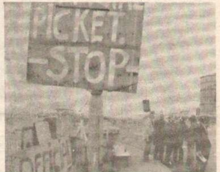
Un piquet de grève à l'entrée d'une entreprise

Pays et peuples condamnent l'agression soviéto-vietnamienne contre le Cambodge