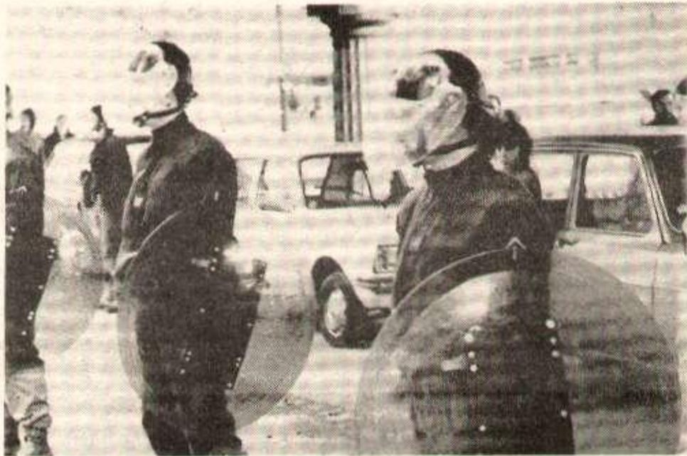
Paris 1978 : une femme sera retrouvée torturée après son passage entre les mains de police secours. Alors que les femmes manifestent pour connaître la vérité, toute la manifestation sera encadrée par la police qui ne cessera de provoquer