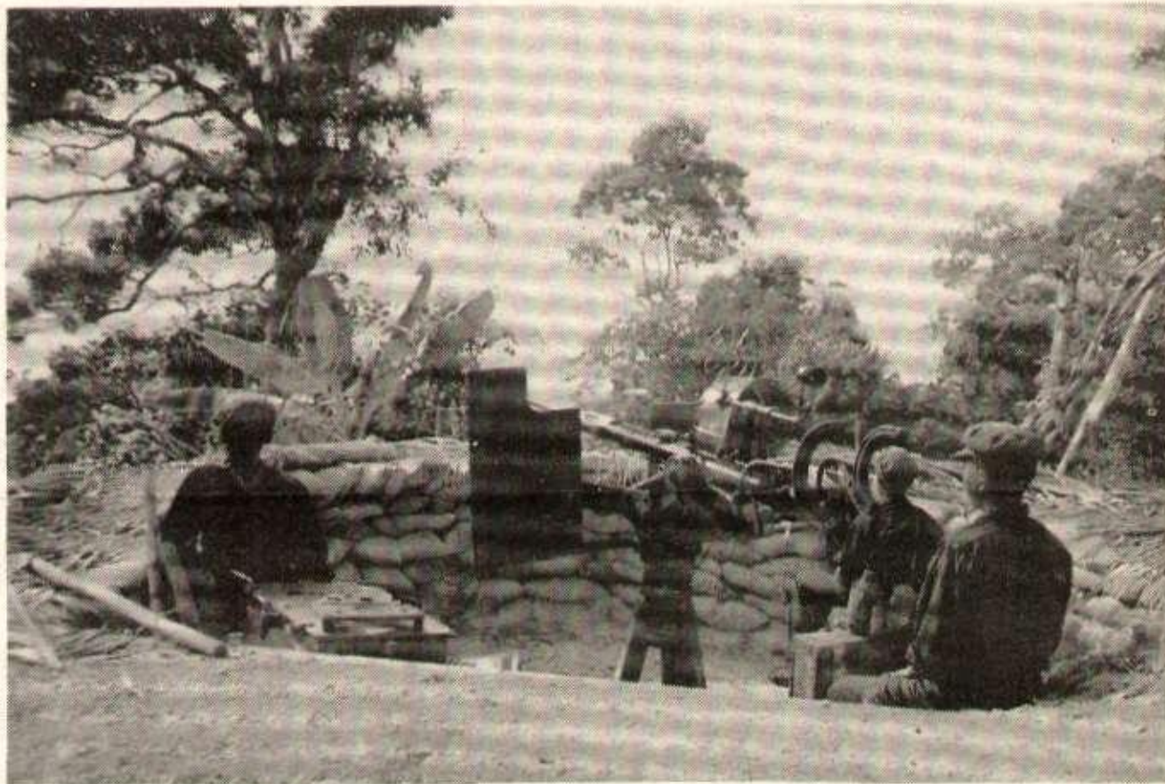
Cambodge 1978. L'armée cambodgienne à l'entraînement dans la défense des côtes maritimes.