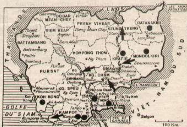
Provinces où se mènent des combats Actions récentes de guérilla.

A LORS que certains journaux occidentaux commencent à faire état de la résistance des patriotes cambodgiens contre l'armée d'invasion vietnamienne, la guérilla se poursuit et même gagne en intensité sur le terrain.