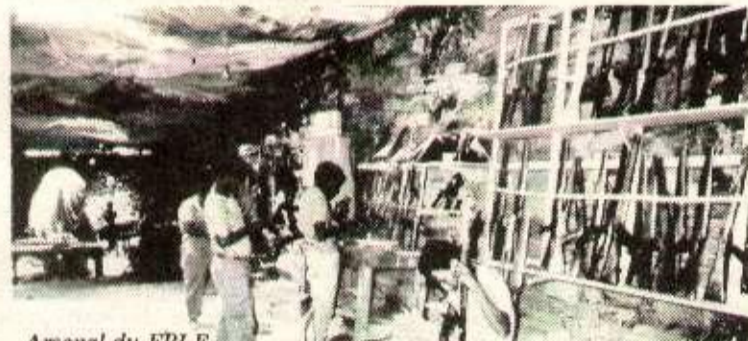
Arsenal du FPLE